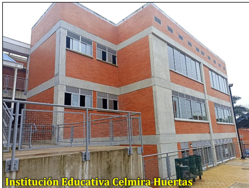
Institución Educativa Celmira Huertas