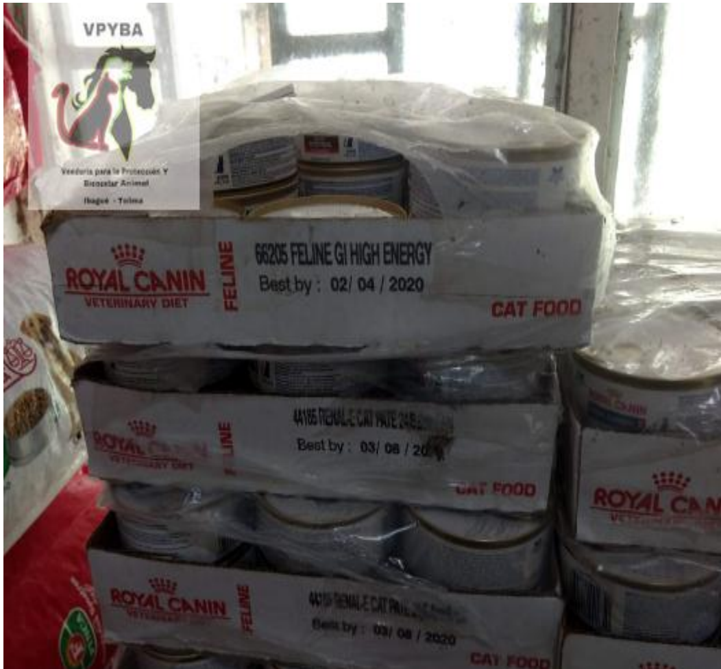
Comida vencida del 8 de Abril del 2020