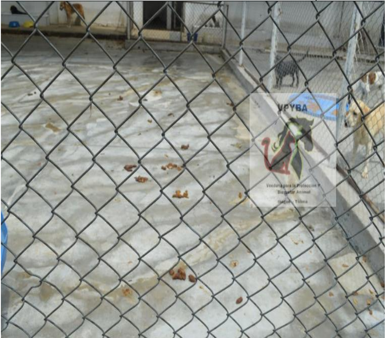
Fotografía de donde permanecen los caninos