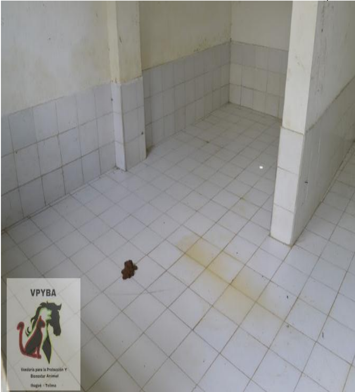
Lugar donde permanecen animales