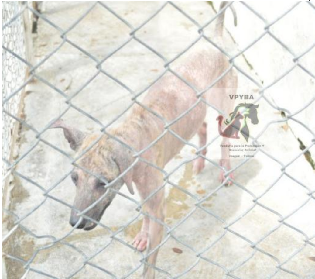
Fotografía de los animales que se encuentran enfermos