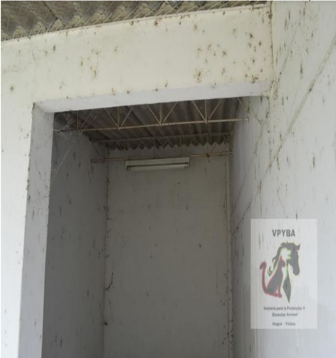
Instalaciones donde permanecen animales