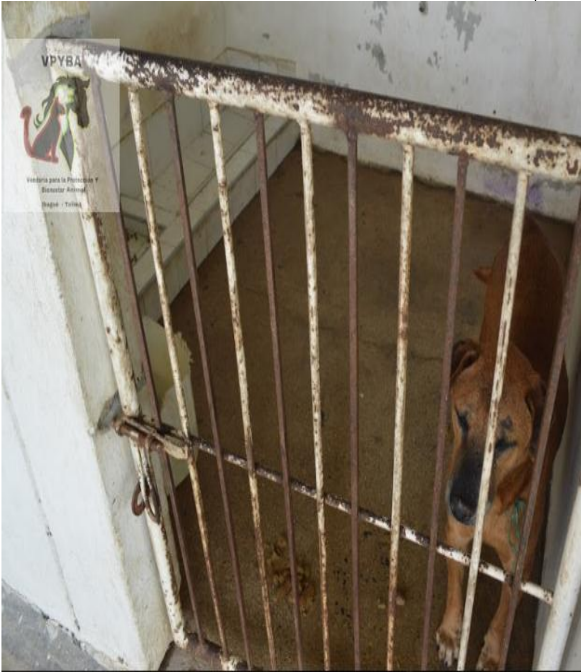
Jaulas de los animales