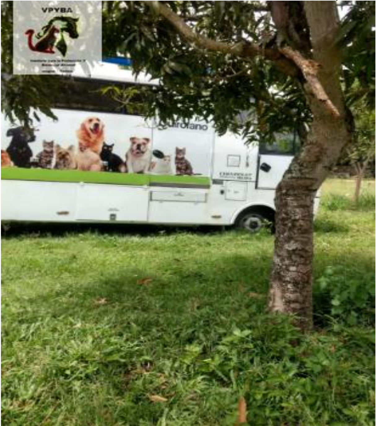
Condiciones de la unidad móvil