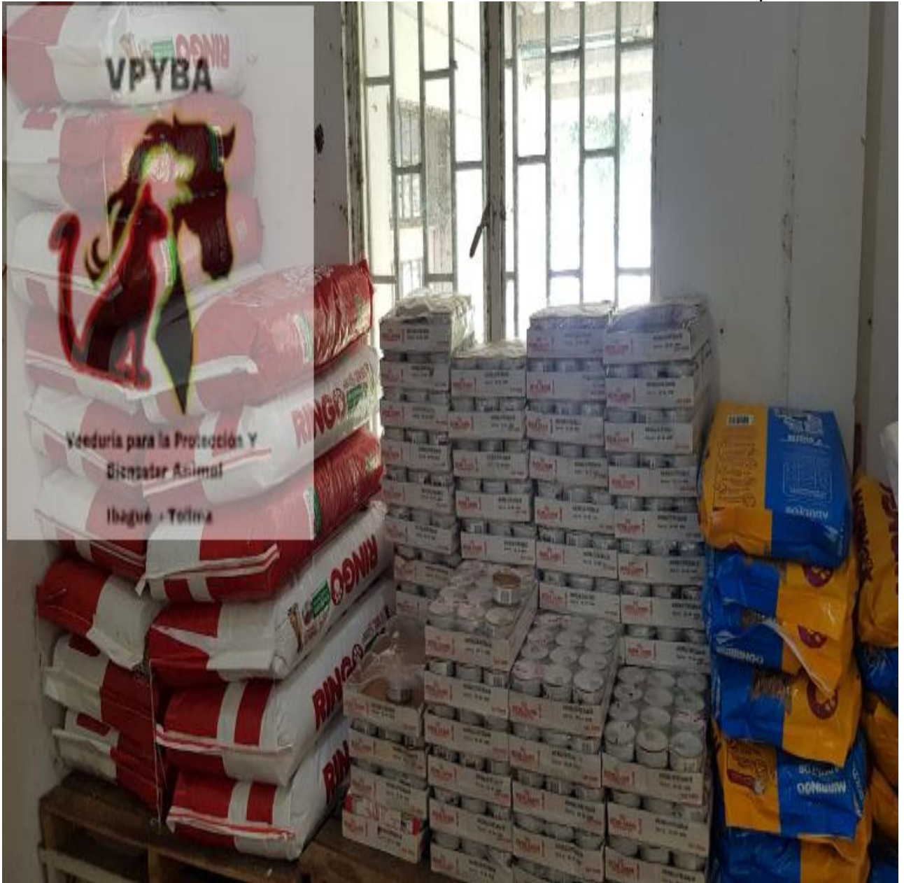
Concentrado de animales de Donación – fecha de vencimiento Agosto