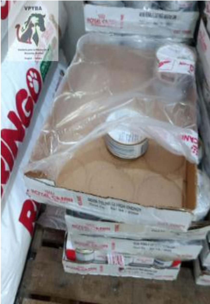
Comida donada a la ALCALDIA DE IBAGUE, comida vencida y se está consumiendo