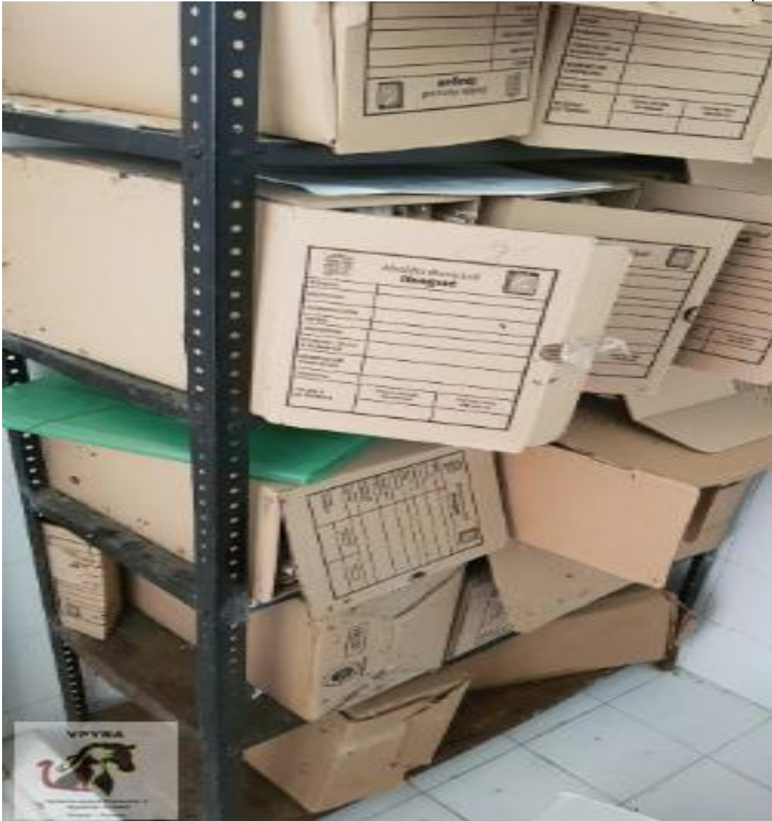
Archivo encontrado en un baño.