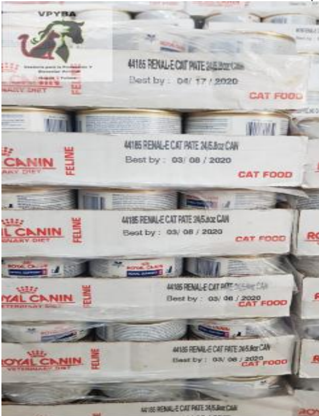
Alimento para gato vencido y consumiéndose (mes/día/año)