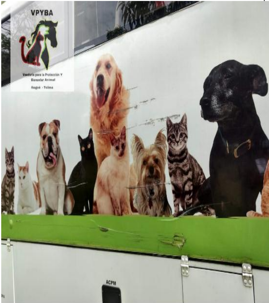
Condiciones de la unidad móvil