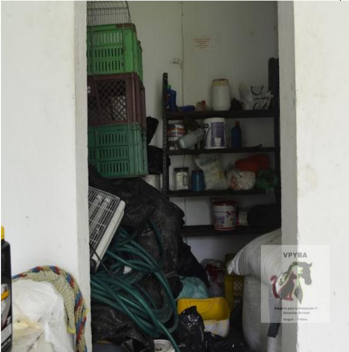
Lugar donde se tiene elementos de aseo guardados