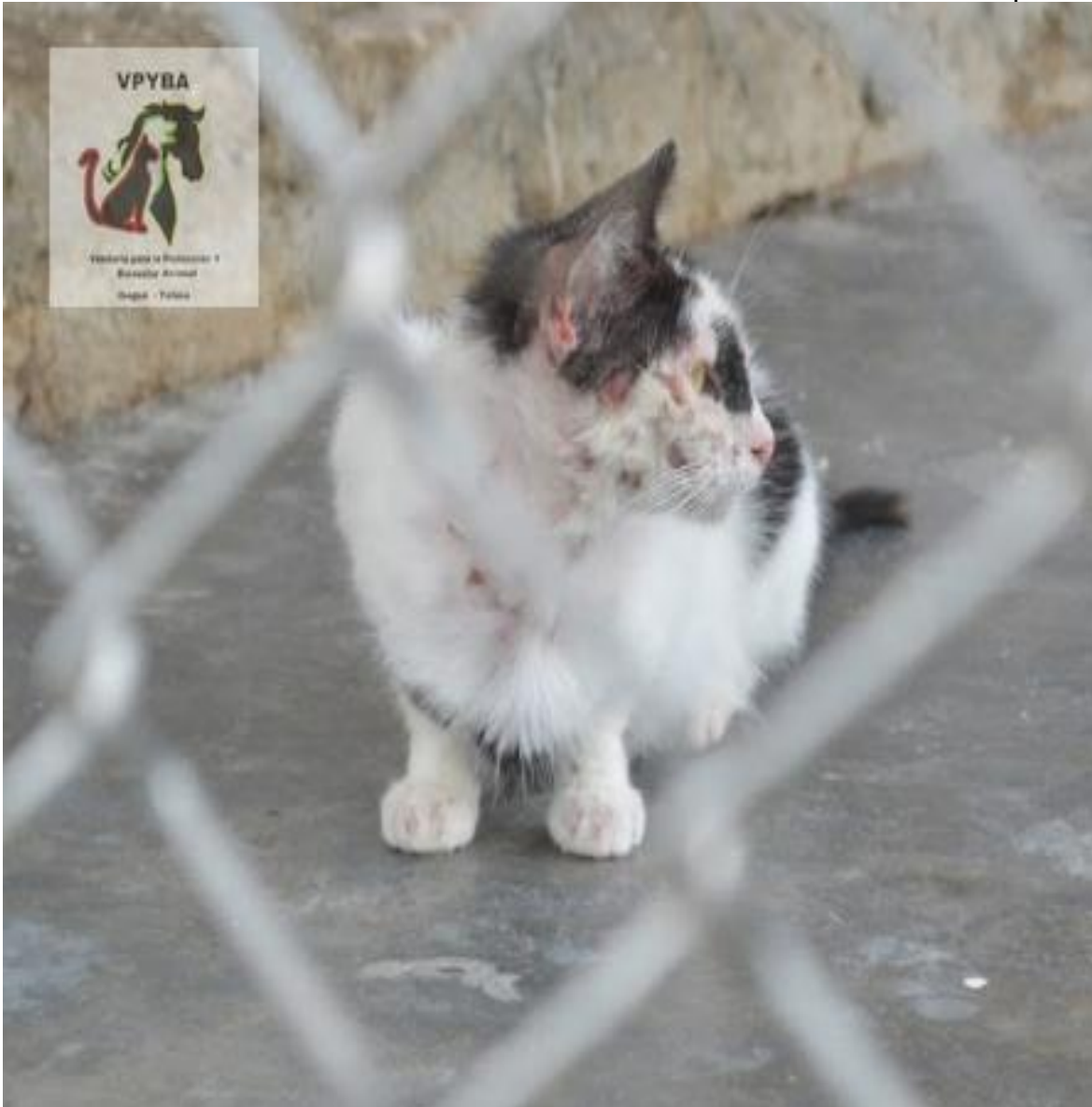
Fotografía de los gatos, todos se encuentran en el mismo lugar, no están apartados unos de otros