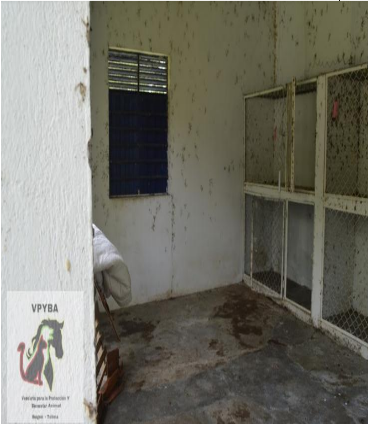
Lugar donde permanecen animales