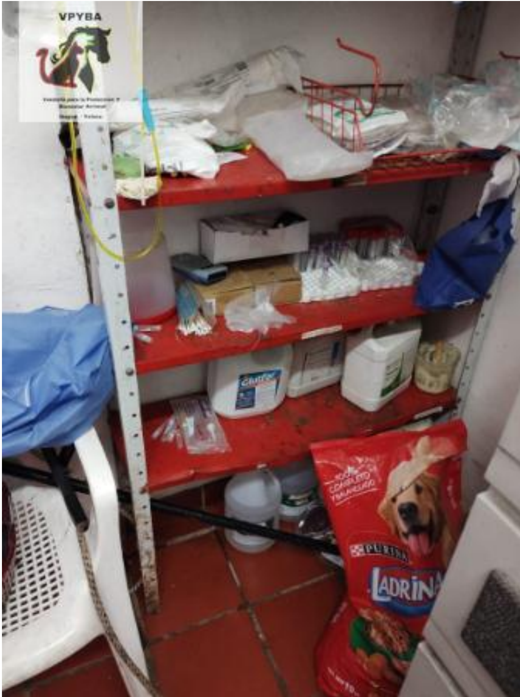
Lugar donde permanecen los medicamentos