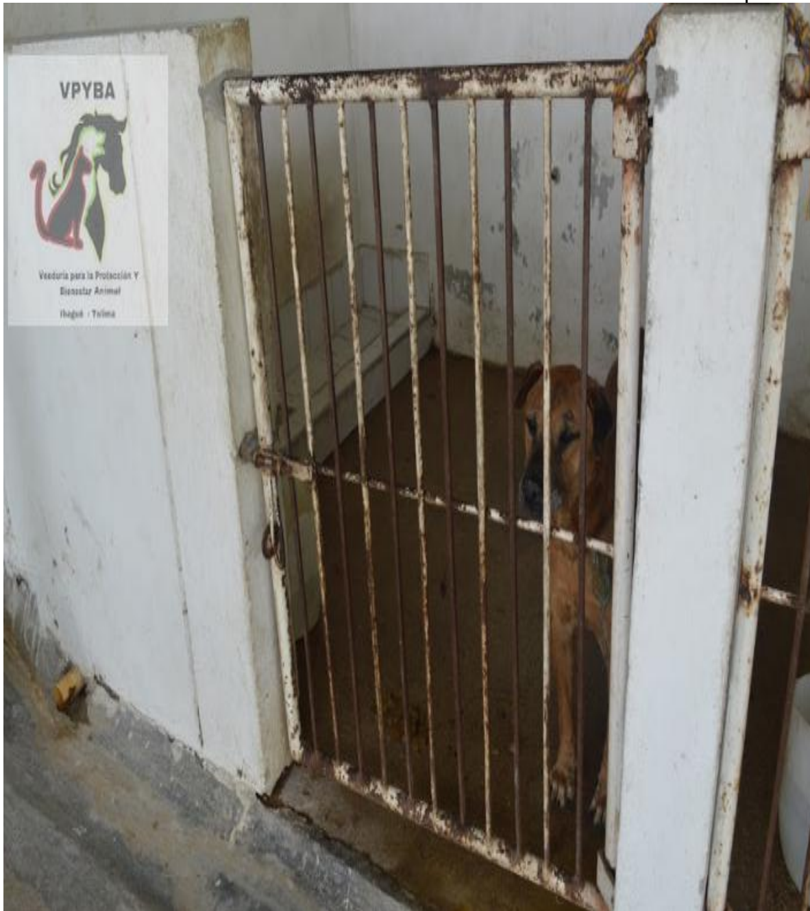
Jaulas de los animales