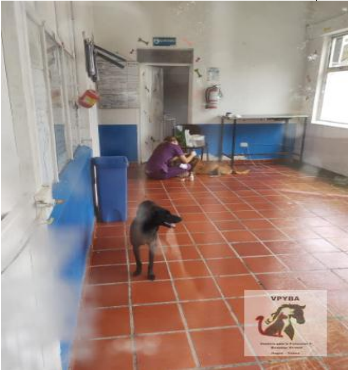
Mesa de Procedimientos quirúrgicos