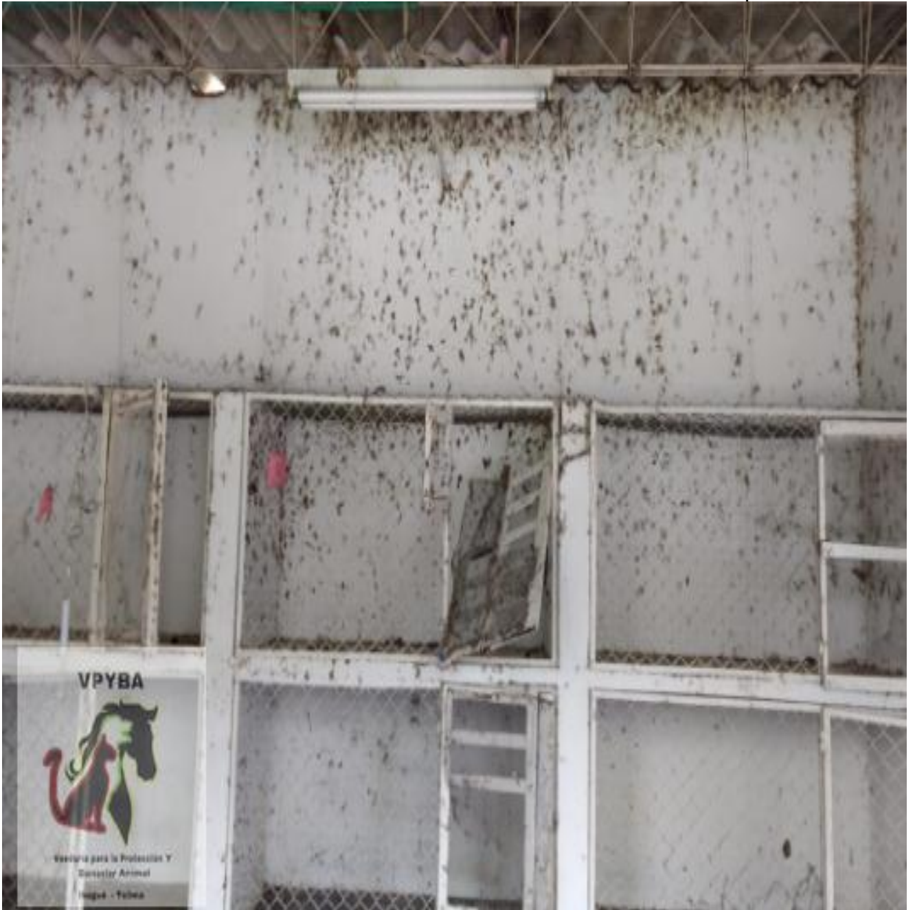
Jaulas de algunos caninos