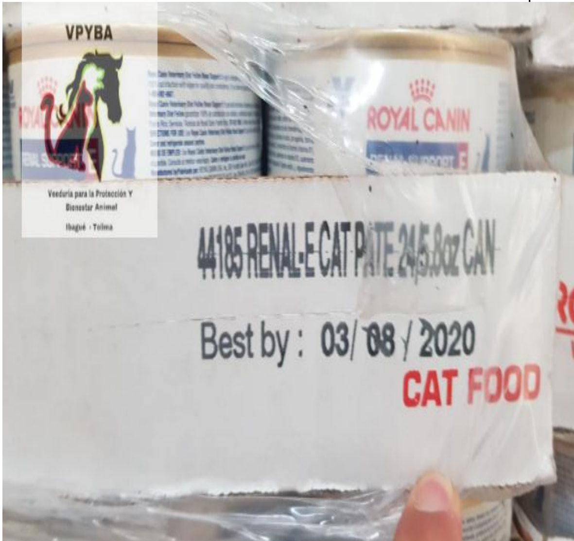
Alimento para gato vencido y consumiéndose (mes/día/año)