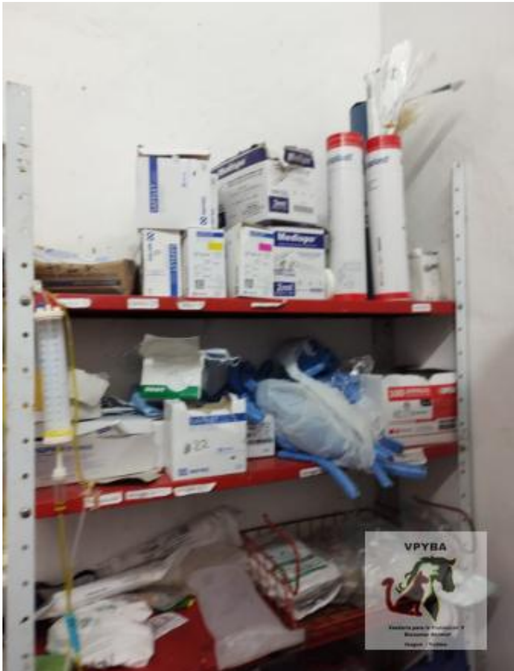
Lugar donde permanecen los medicamentos