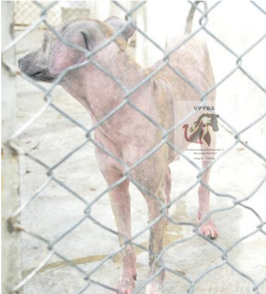
Fotografía de los animales que se encuentran enfermos