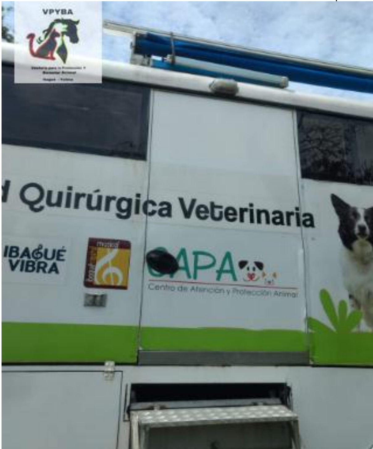
Condiciones de la unidad móvil