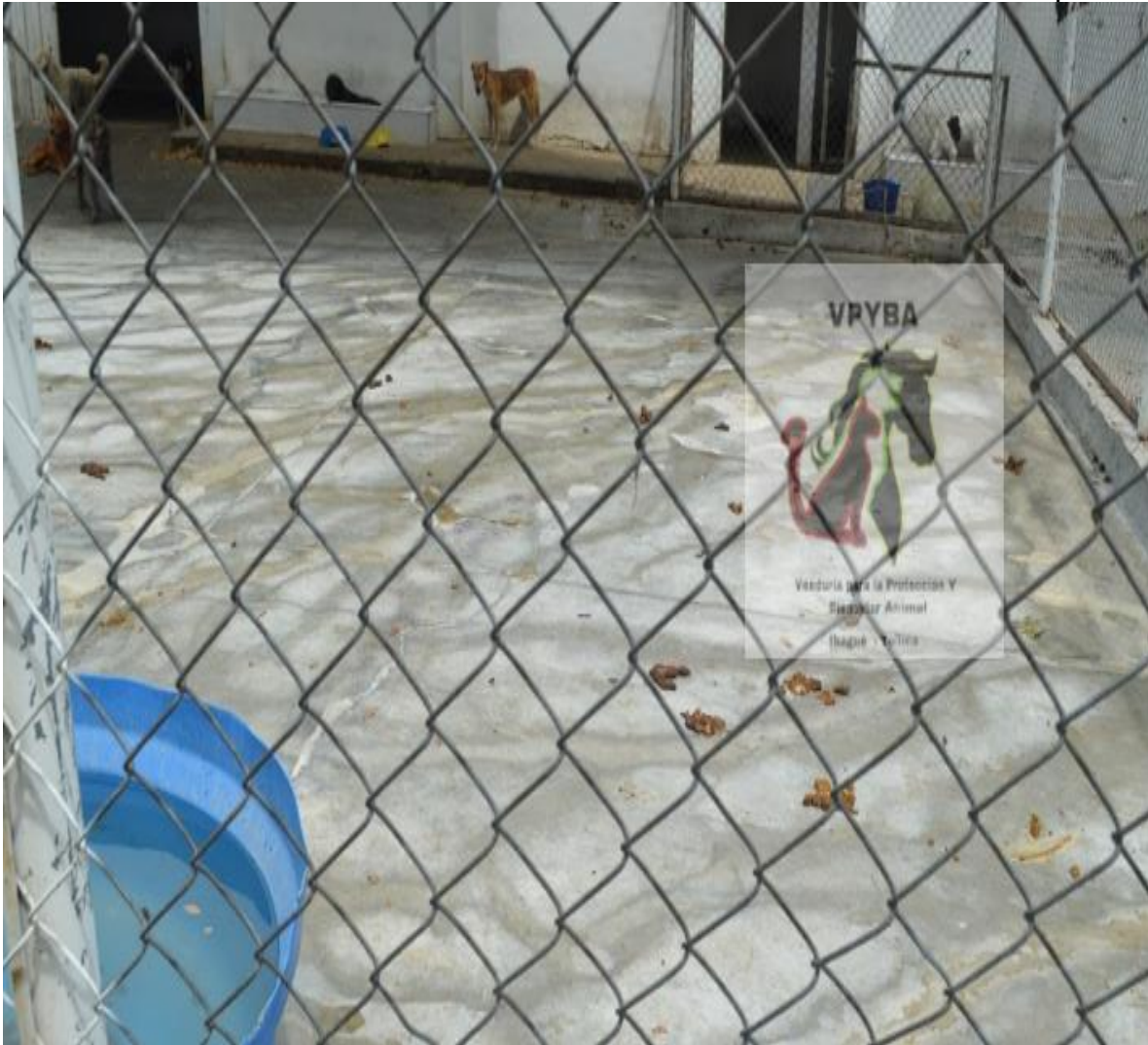
Fotografía de donde permanecen los caninos