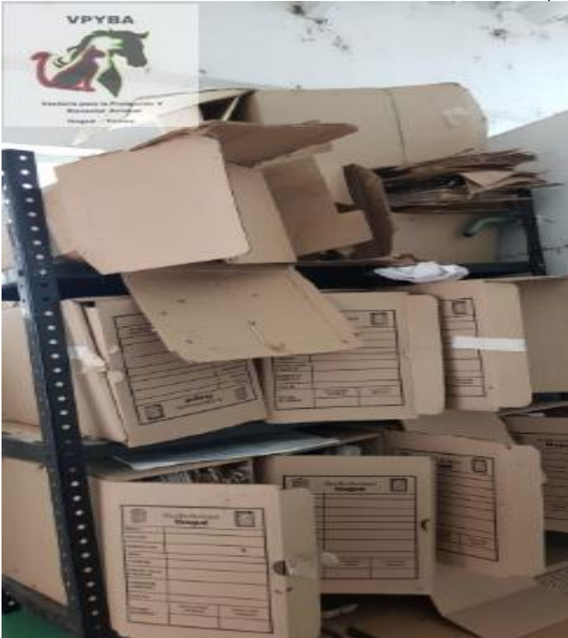
Archivo encontrado en un baño.