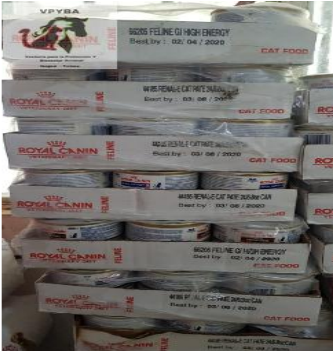
Alimento para gato vencido y consumiéndose (mes/día/año)