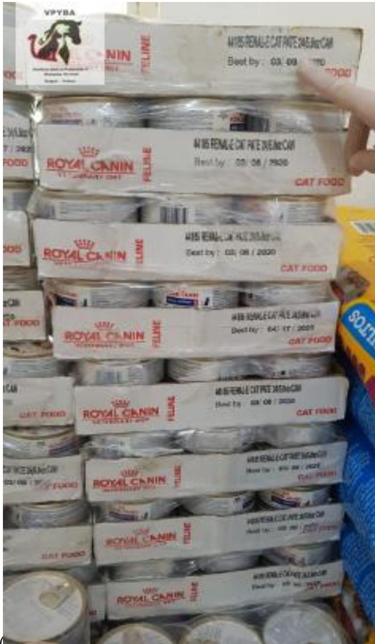
Alimento para gato vencido y consumiéndose (mes/día/año)