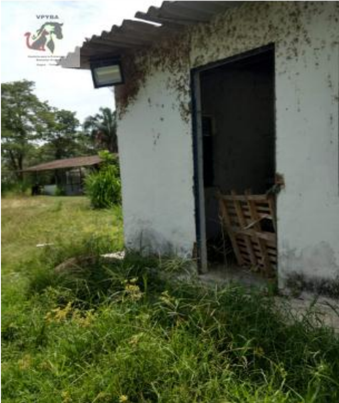
Fotografía del lugar donde estaban algunos animales