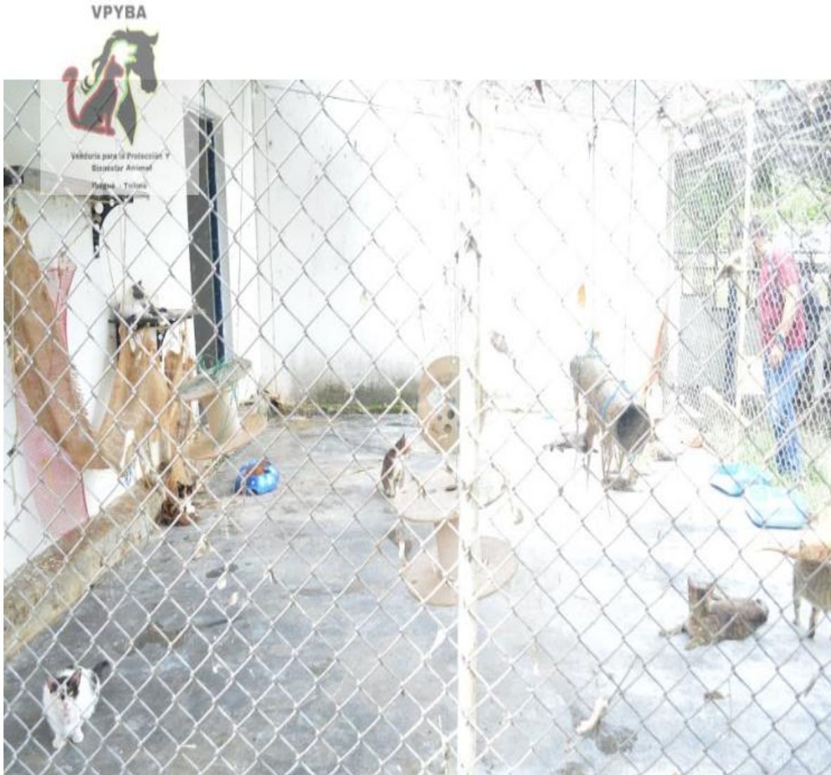
Gatera con todos los felinos mezclados