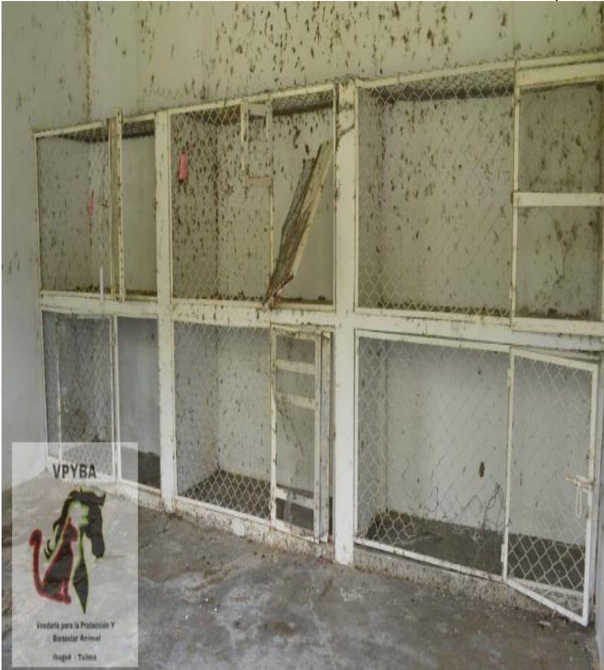
Jaulas de algunos caninos