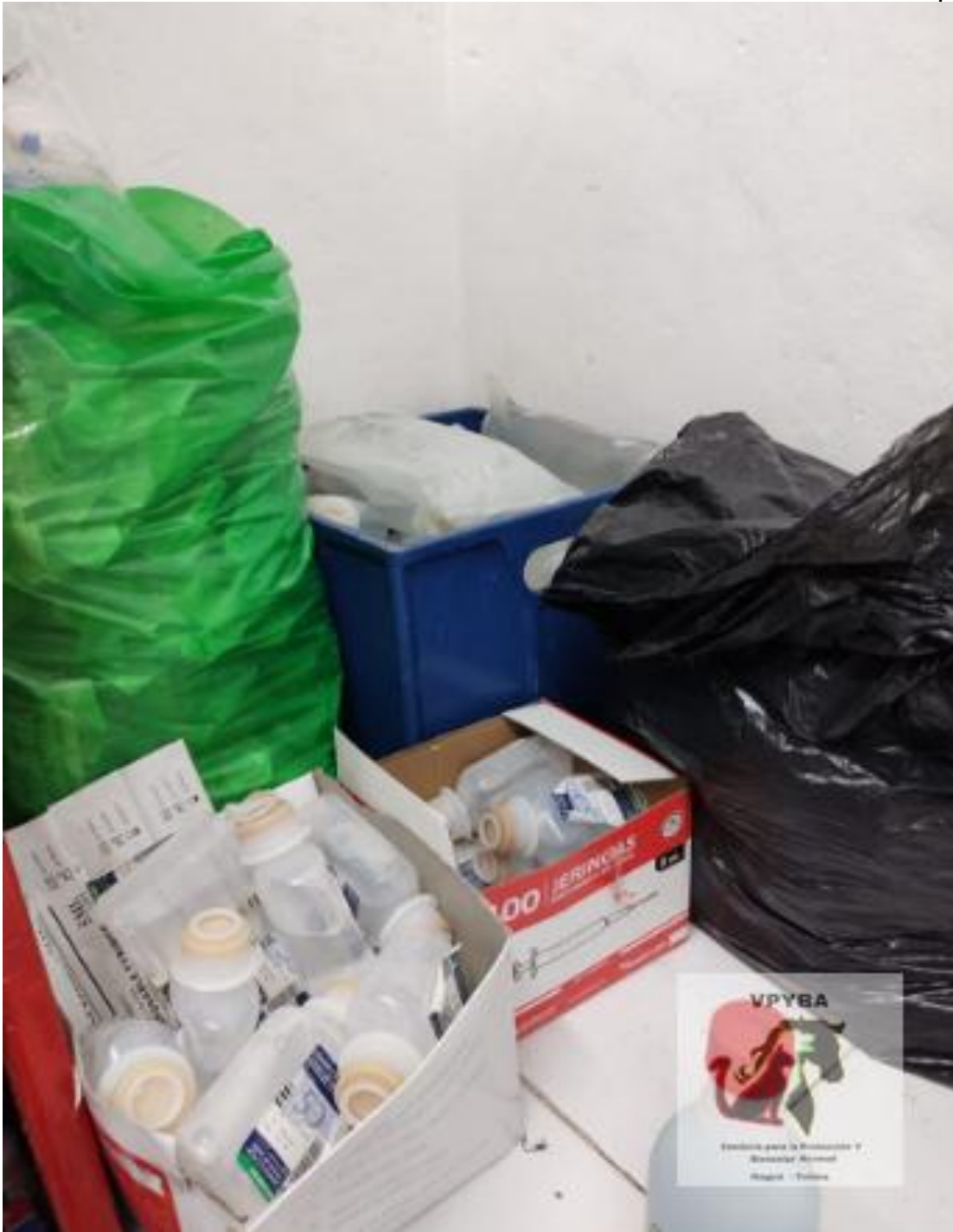
Lugar donde permanecen los medicamentos