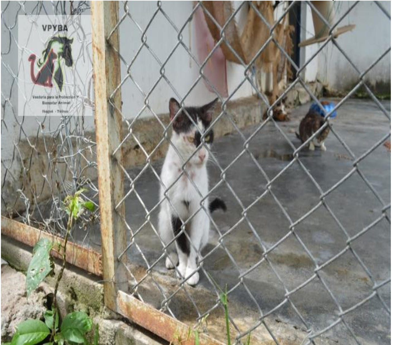
Gatera con todos los Felinos mezclados