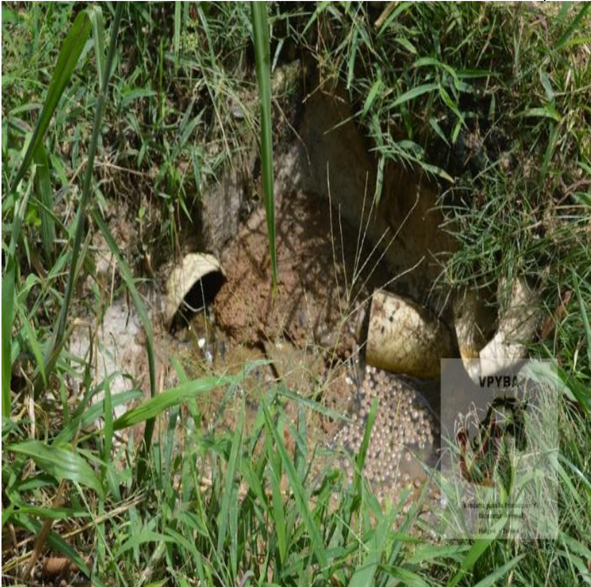
Vertimientos de tubería donde sale el excremento que tiran a la tubería – sin señalización por lo que alguien puede caer en ello.