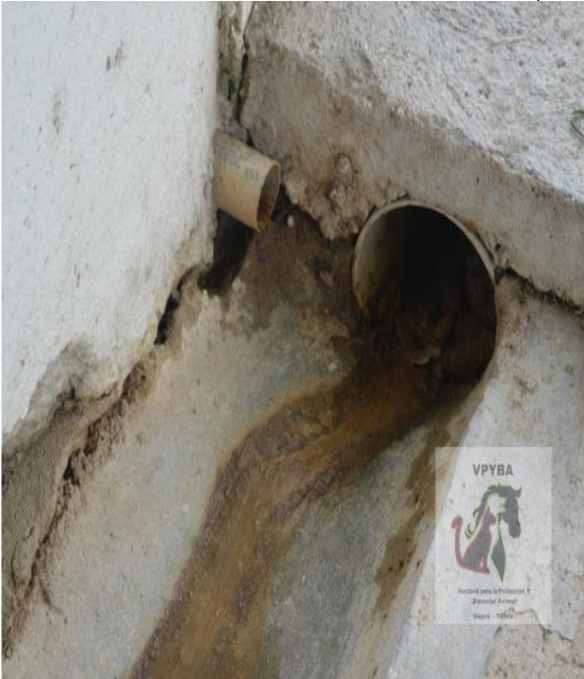
Vertimientos donde desemboca el estiércol de los animales y que está cerca a los animales