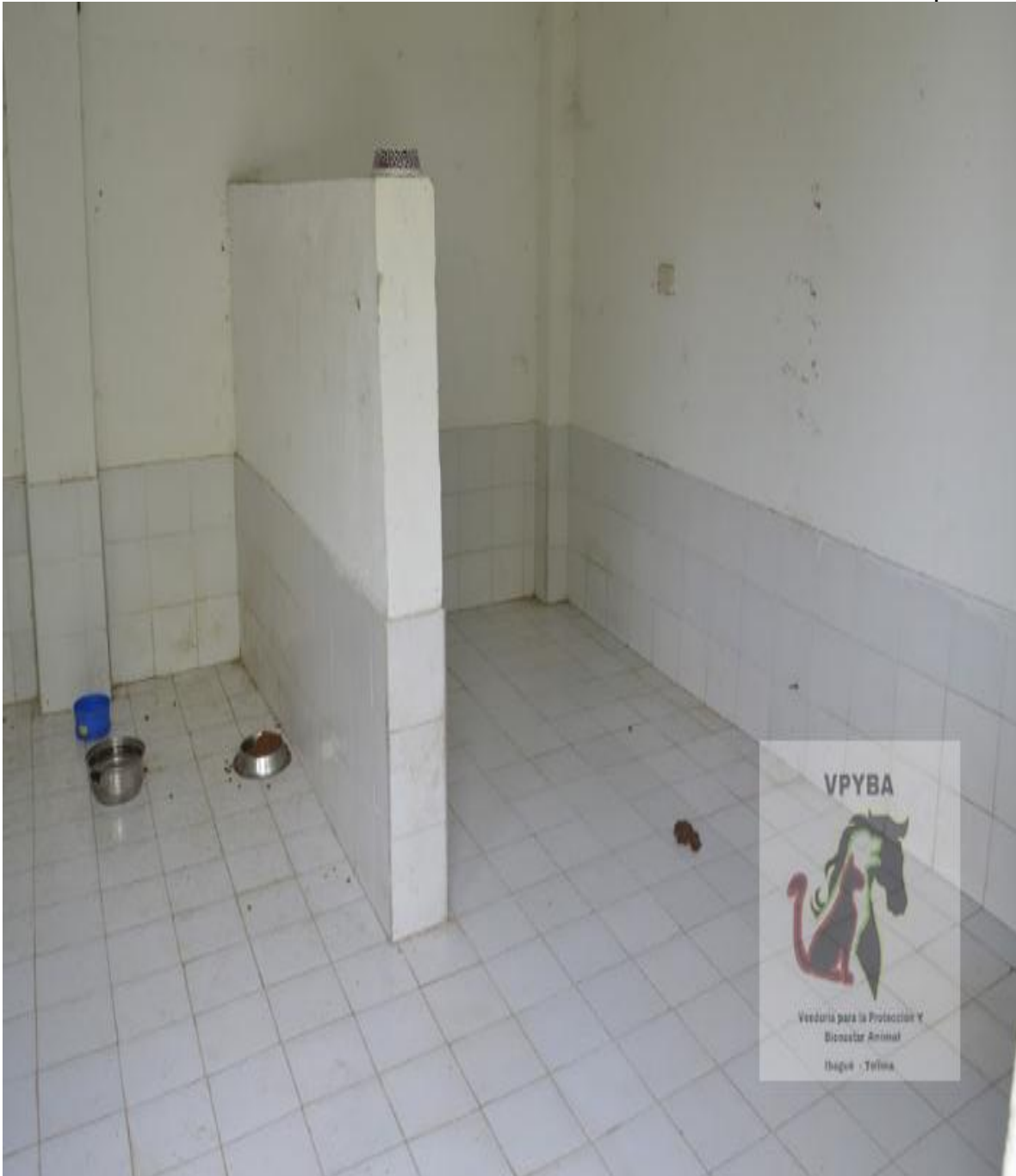
Lugar donde permanecen animales