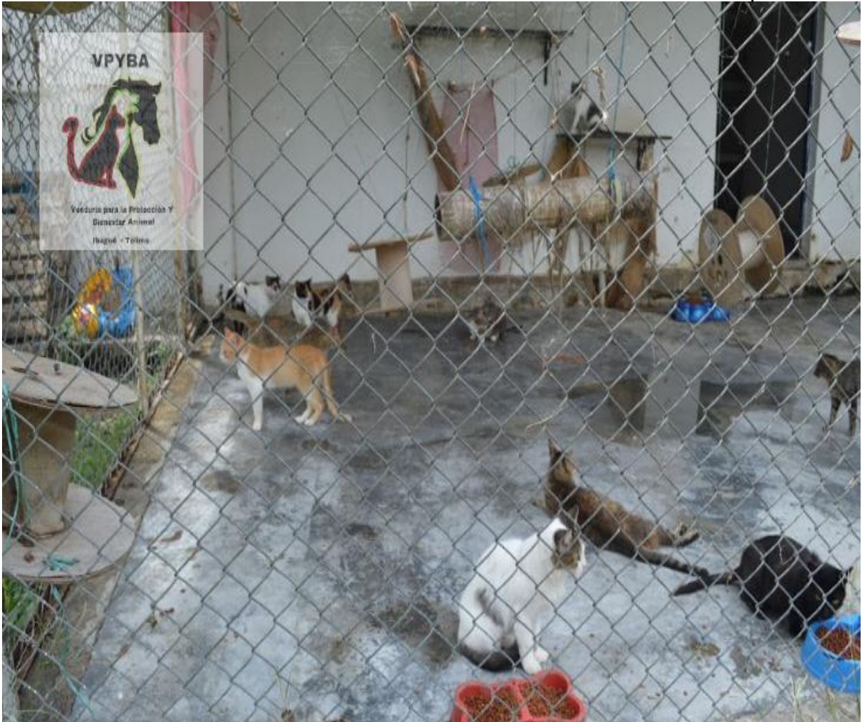
Gatera con todos los felinos mezclados