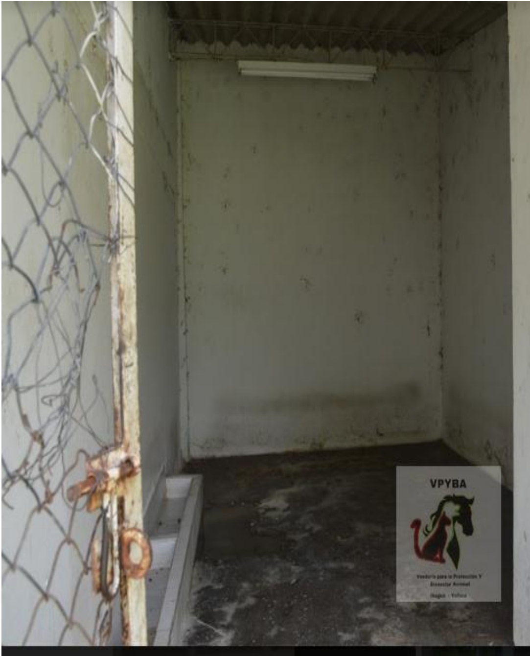
Instalaciones donde permanecen animales