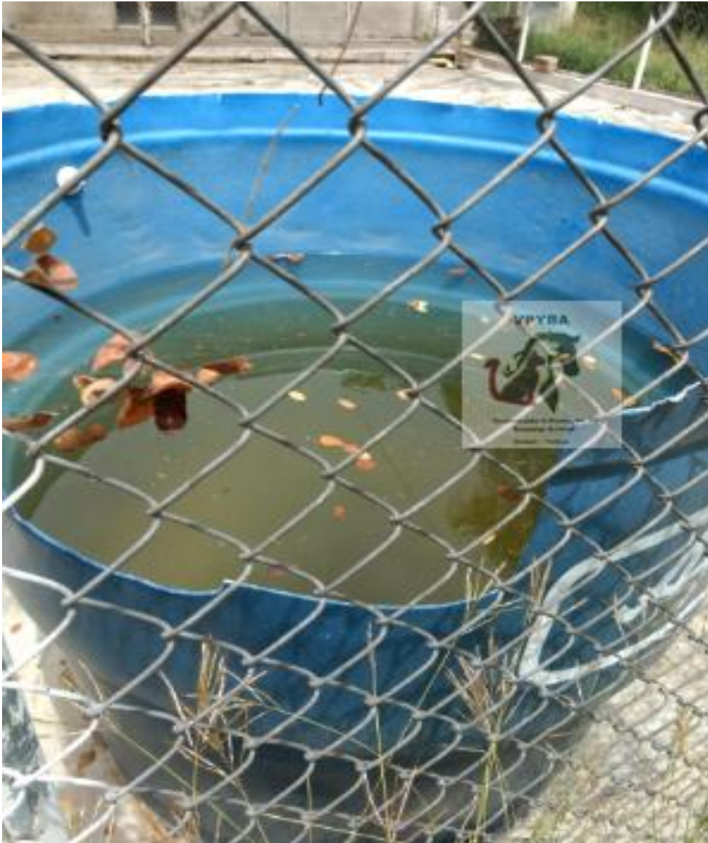
Fotografía del bebedero de los caninos