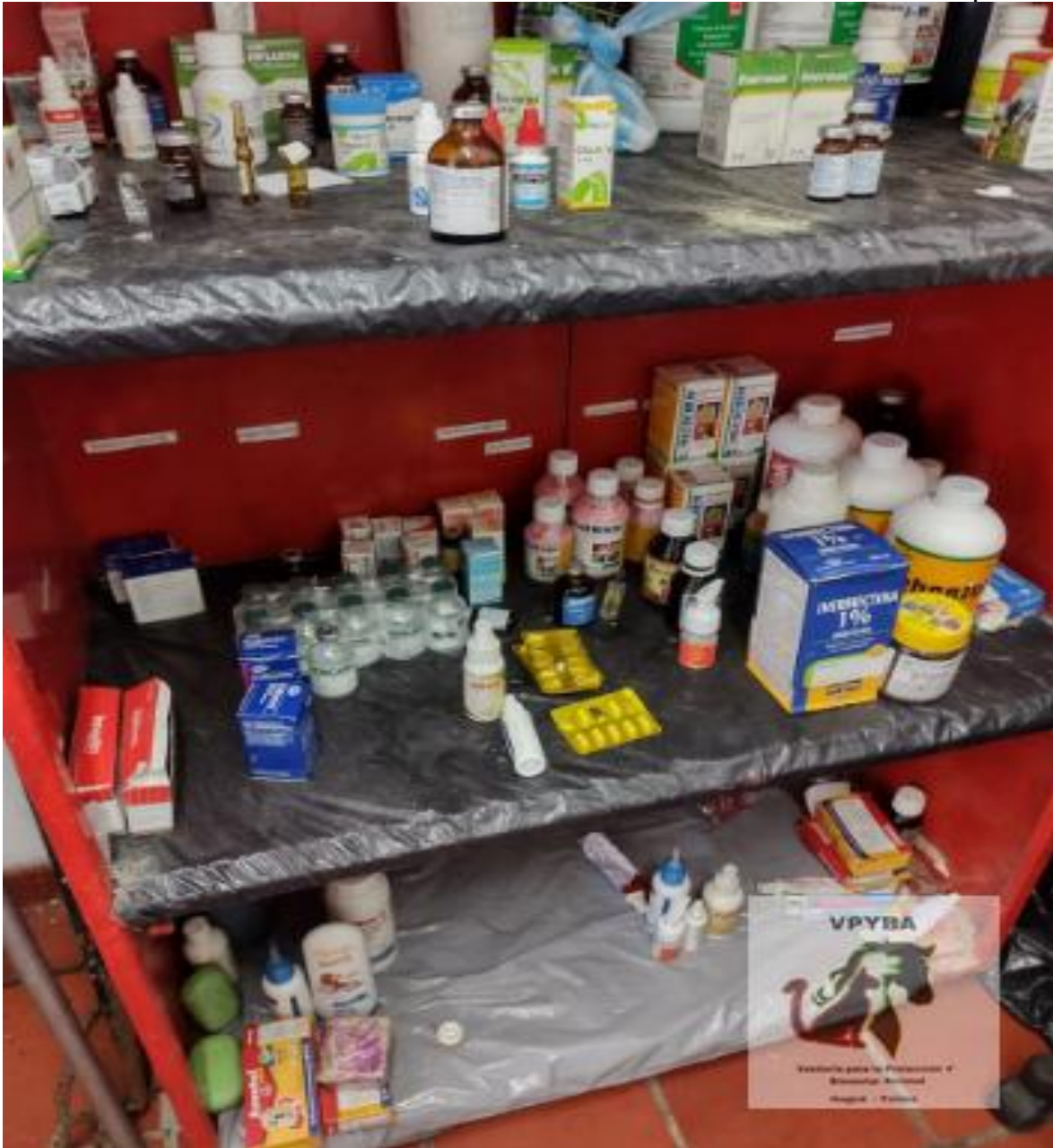
Lugar donde permanecen los medicamentos y quirurgico