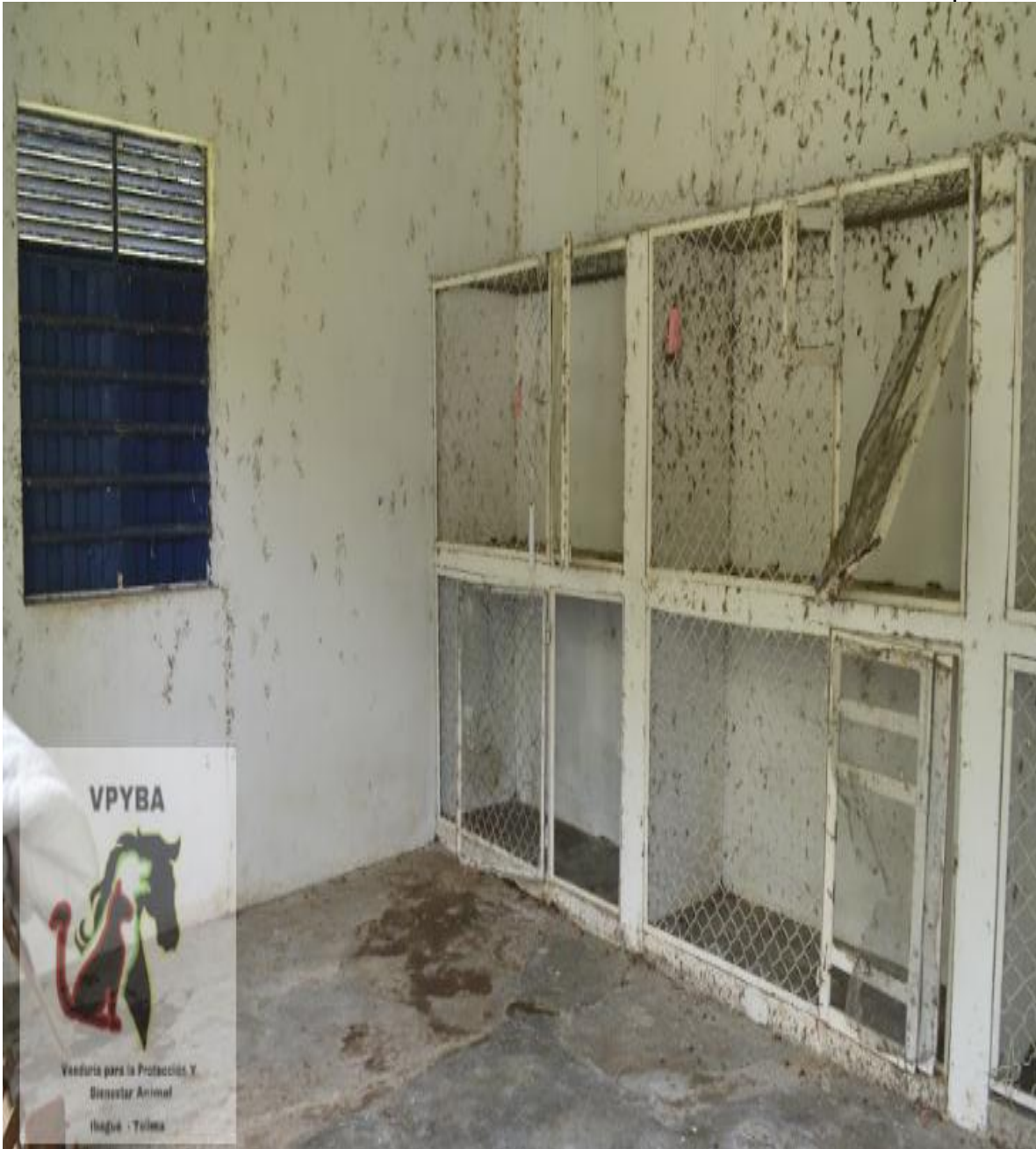
Lugar donde permanecen animales