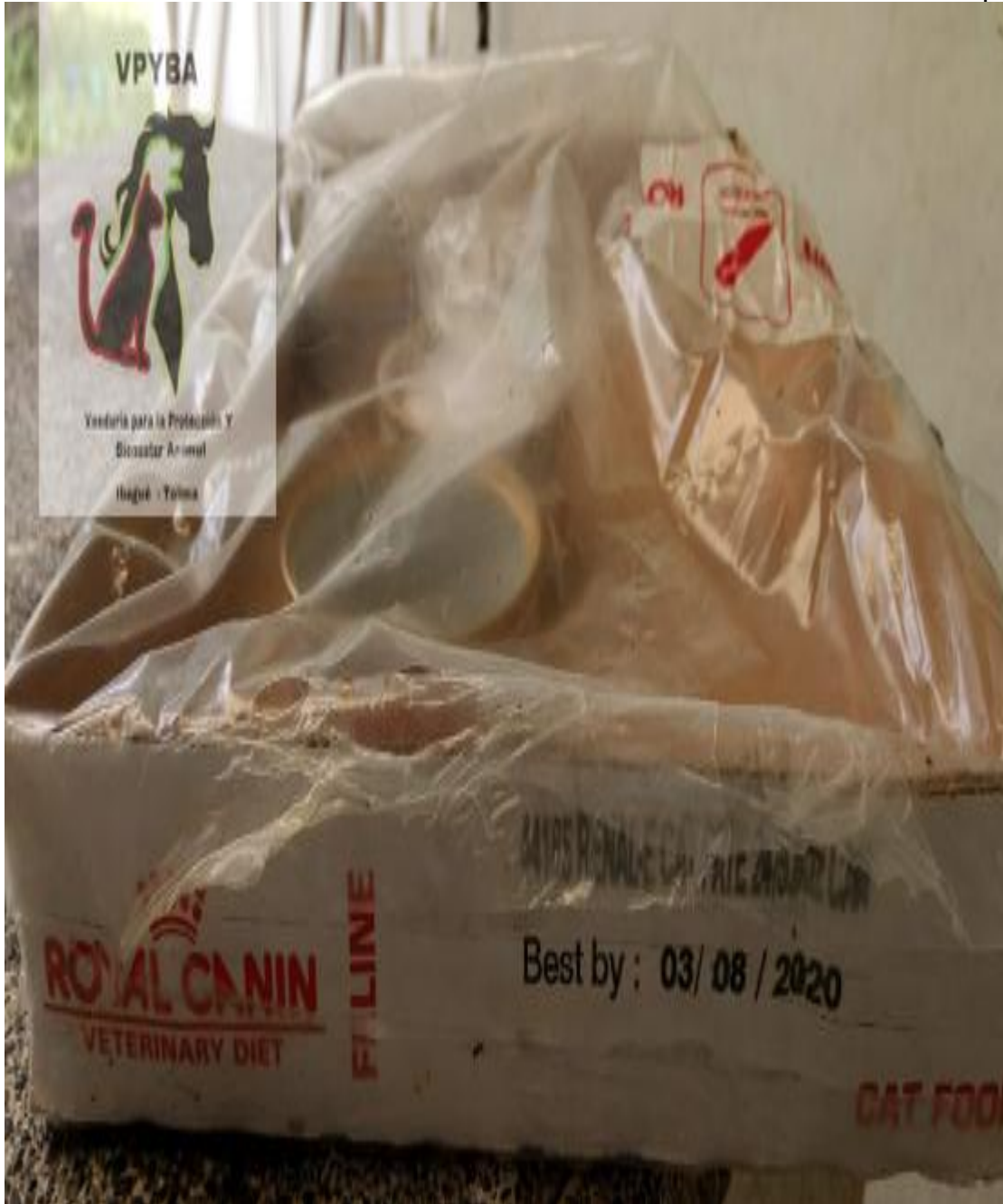
Comida donada a la ALCALDIA DE IBAGUE, comida vencida y se está consumiendo