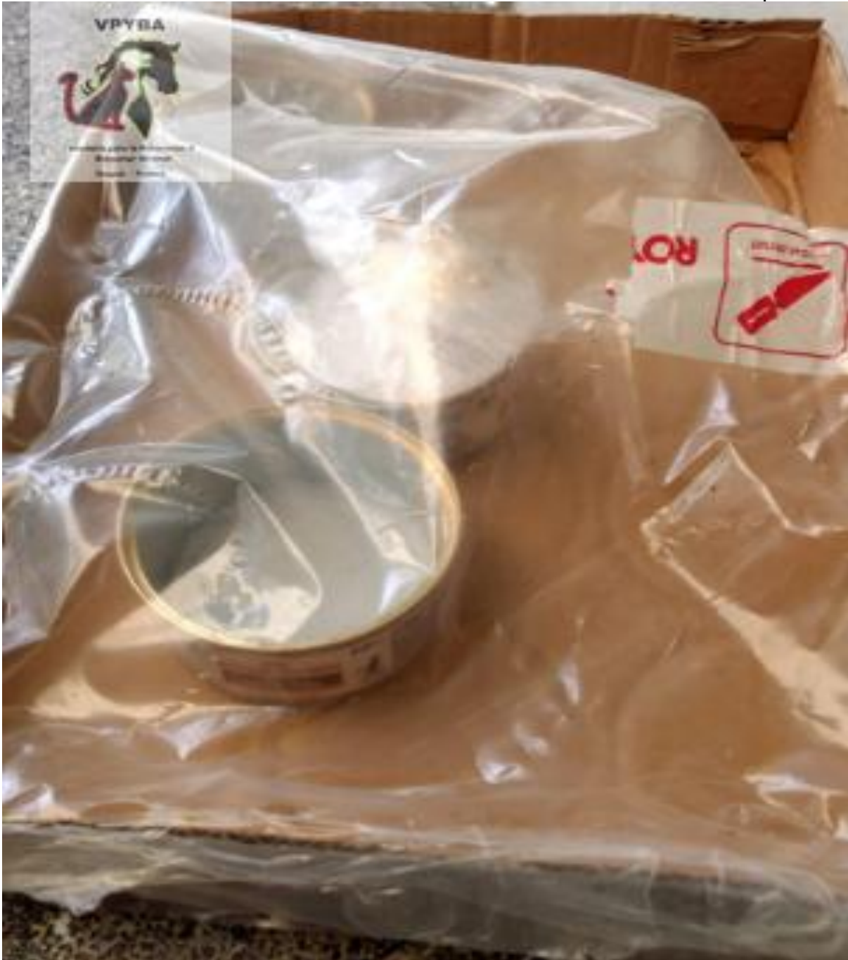
Comida donada a la ALCALDIA DE IBAGUE, comida vencida y se está consumiendo