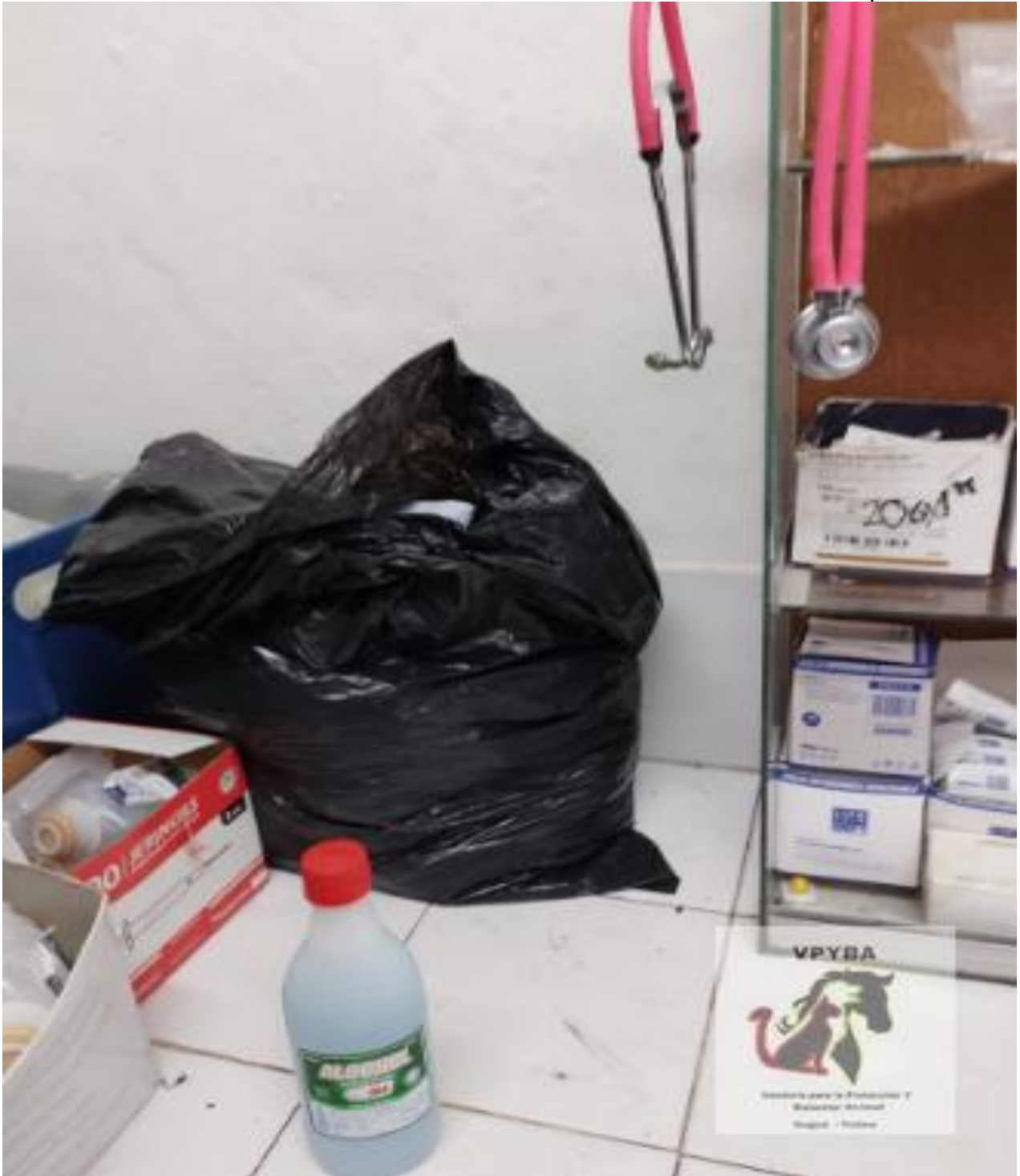
Lugar donde permanecen los medicamentos