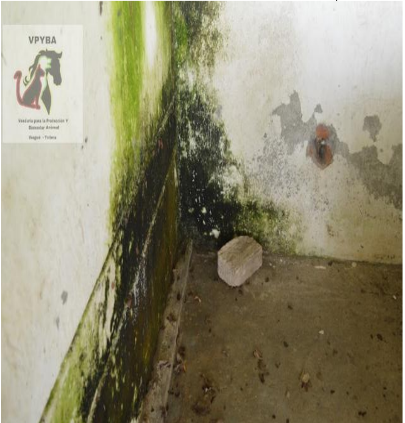
Jaulas donde permanecen los animales