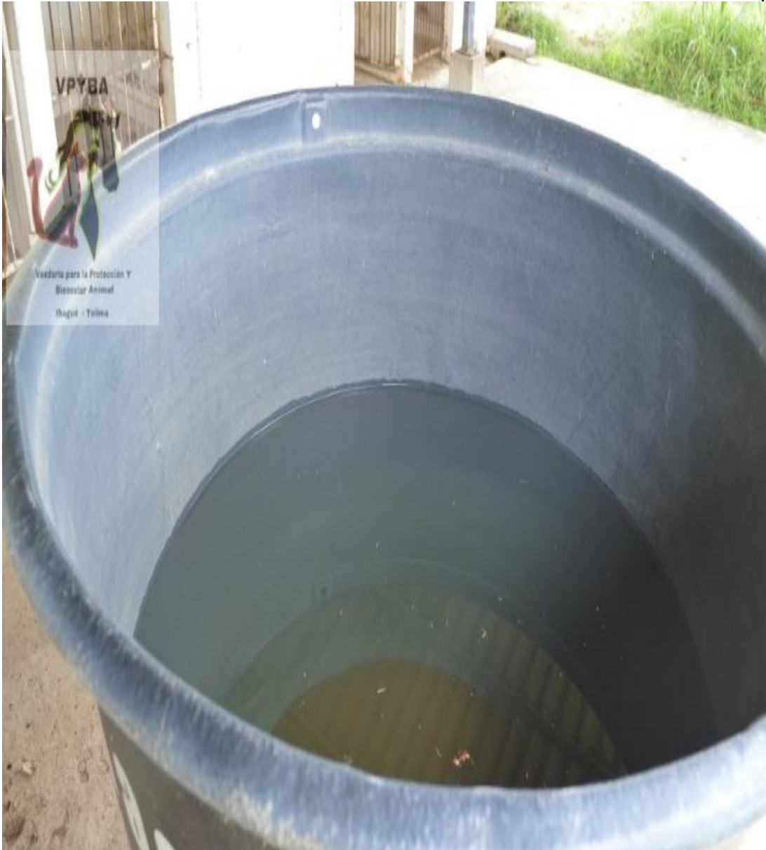
Lugar donde permanece el agua que es usada para dar hidratar a los animales