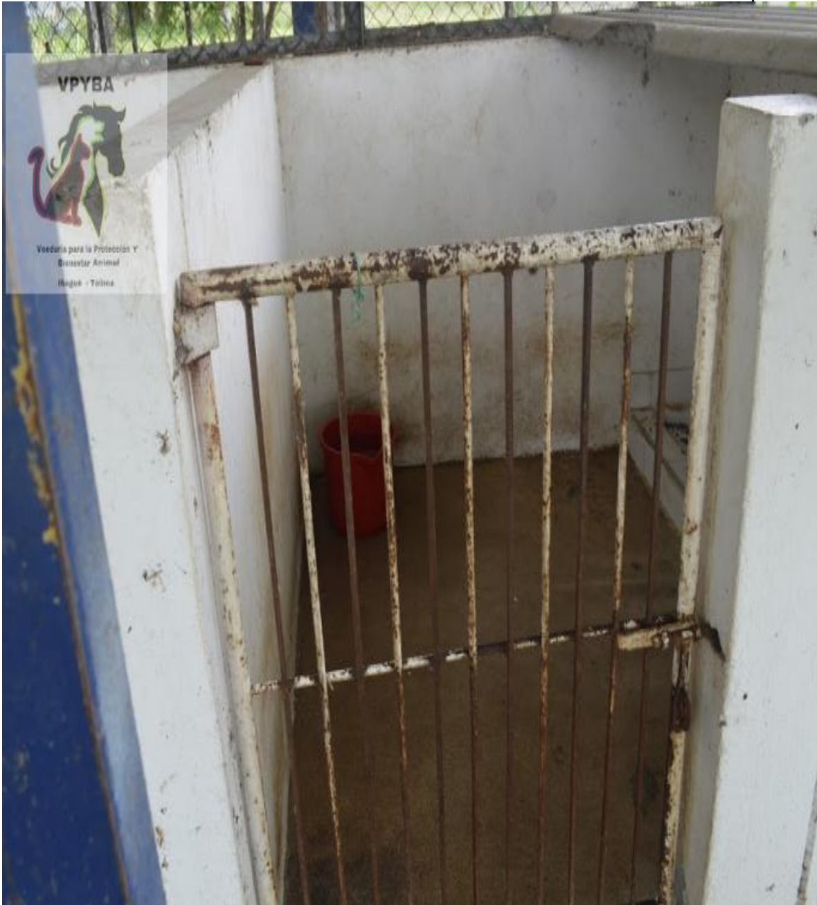
Jaula de los animales