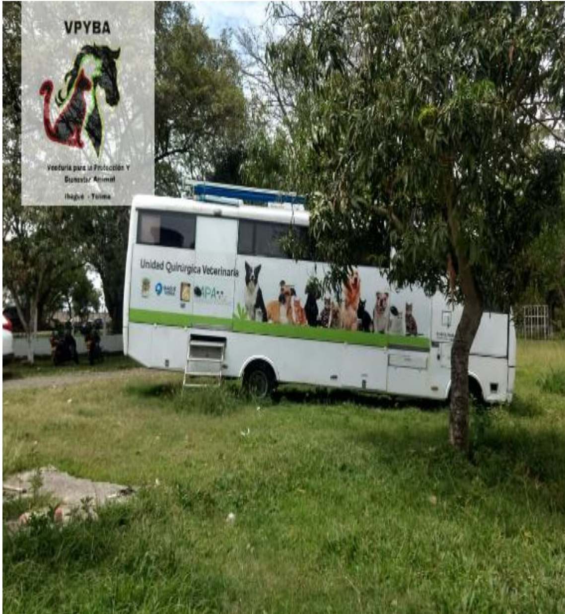
Condiciones de la Unidad móvil