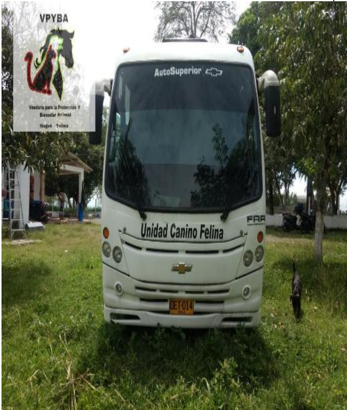
Unidad móvil estacionada con más de 6 meses y con maleza