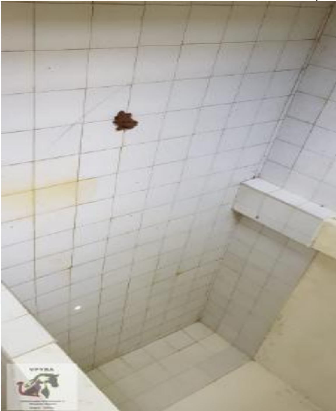
Lugar donde permanecen animales