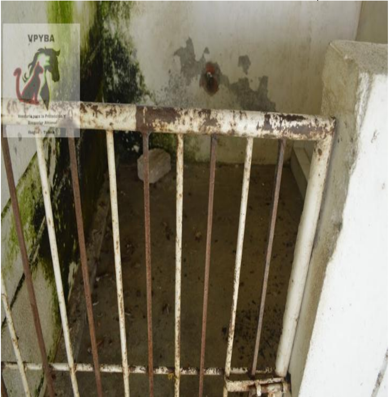
Jaulas donde permanecen los animales