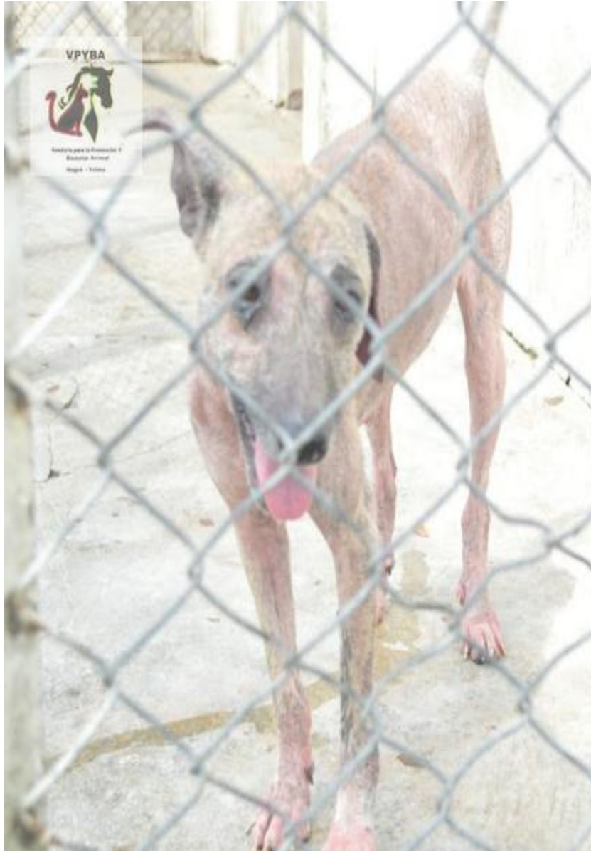
Fotografía de los animales que se encuentran enfermos