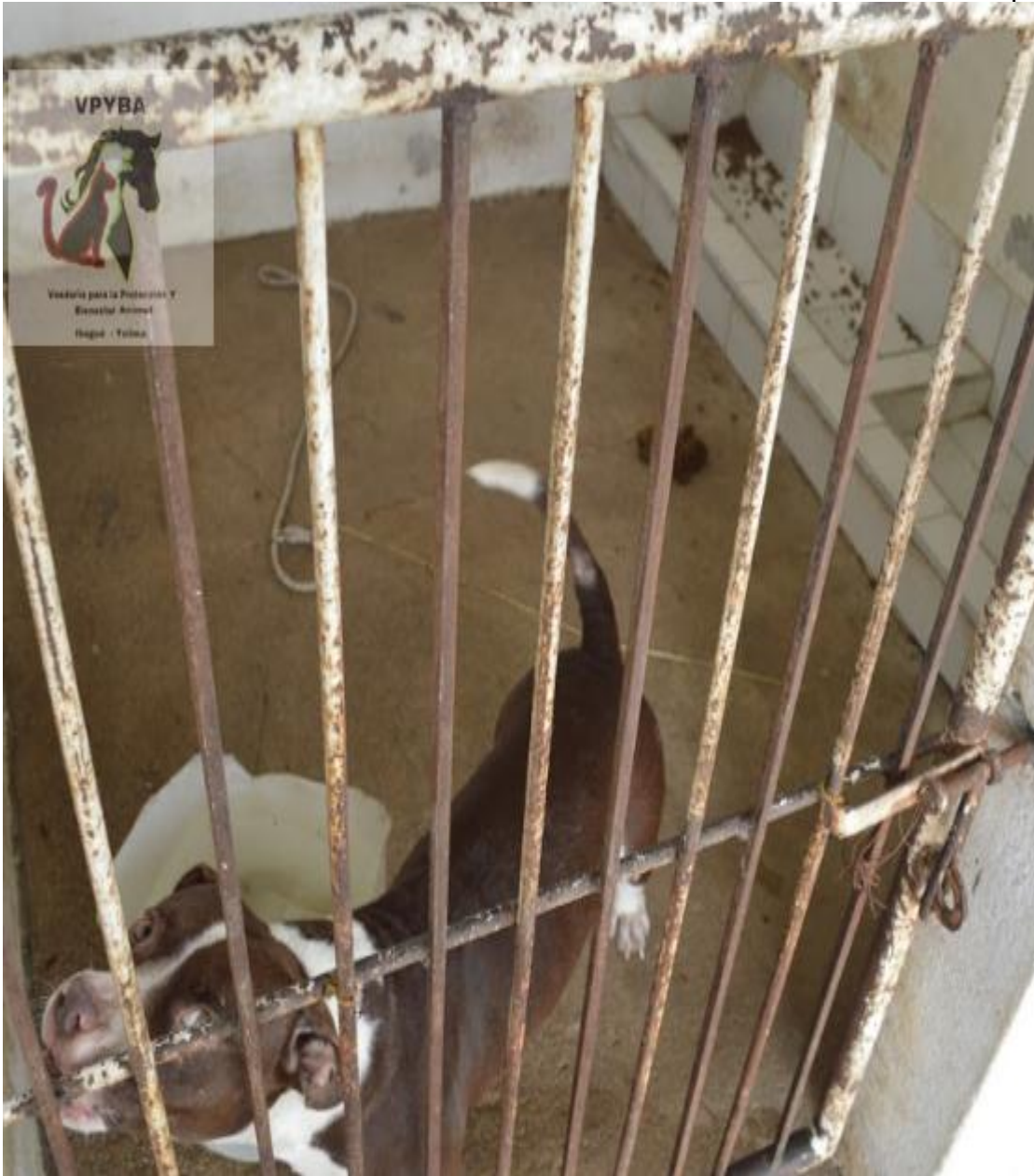
Jaulas de los animales