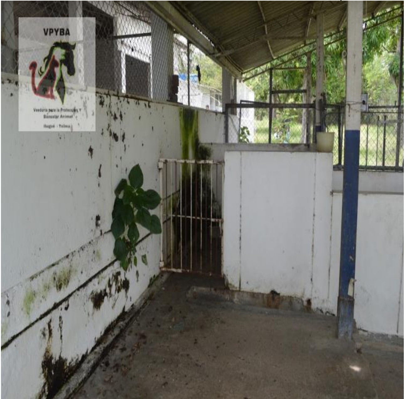
Jaulas donde permanecen caninos