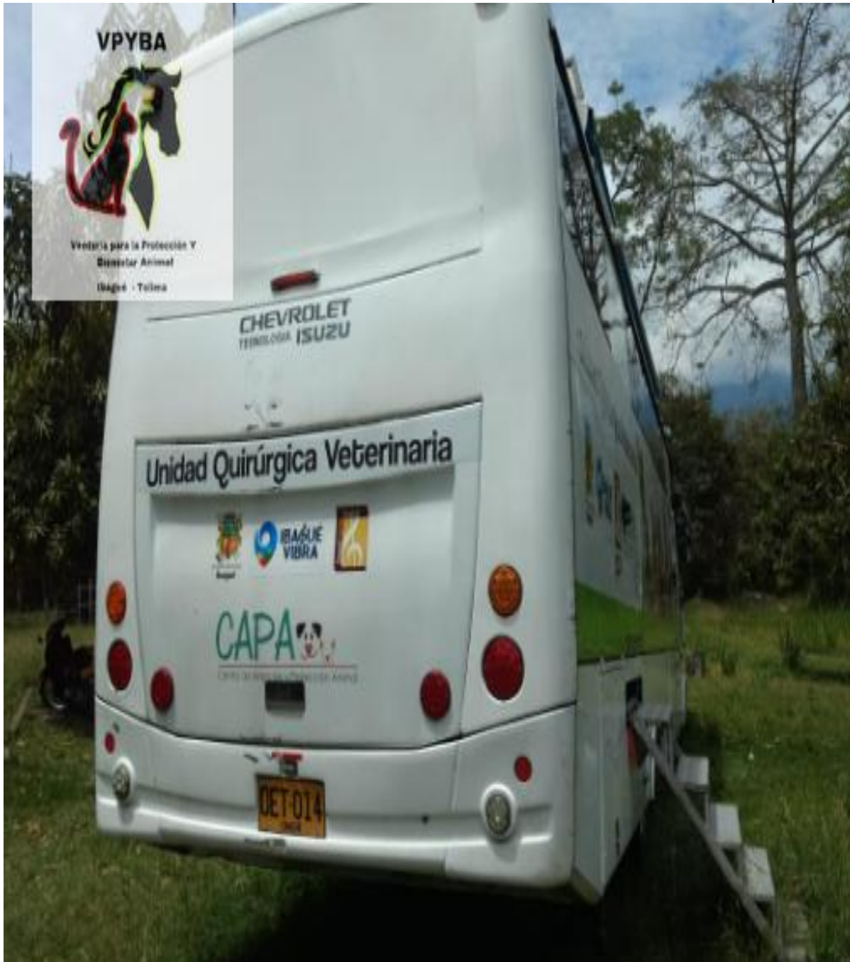
Unidad móvil estacionada con más de 6 meses y con maleza