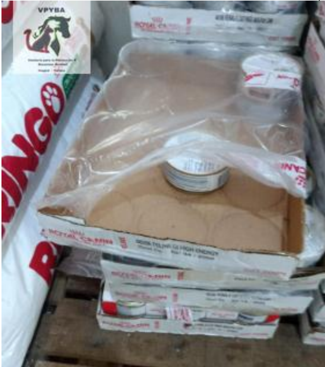
Alimento para gato vencido y consumiéndose (mes/día/año)