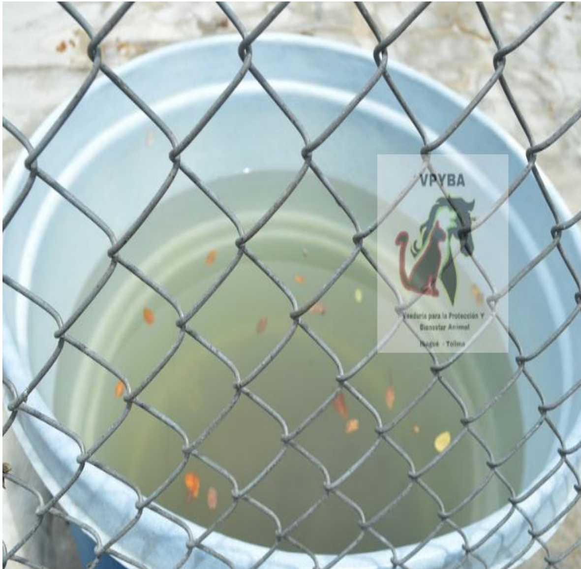
Agua que toman los animales