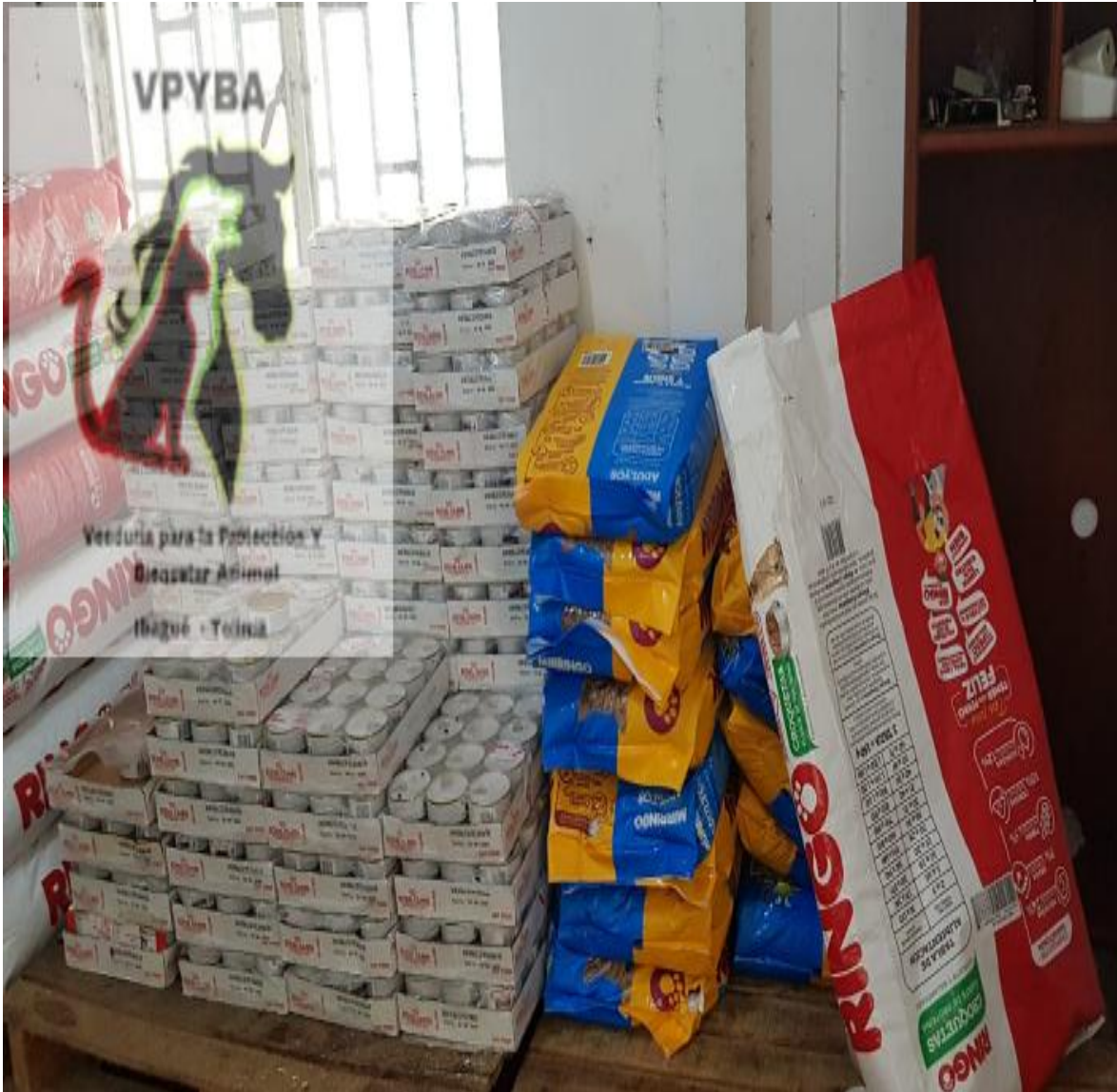
Concentrado de animales de Donación – fecha de vencimiento Agosto