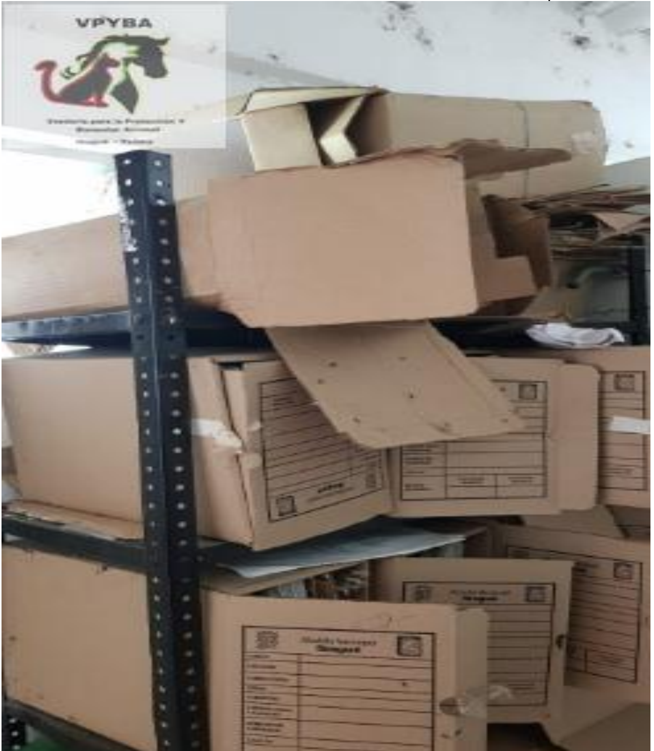
Archivo encontrado en un baño.