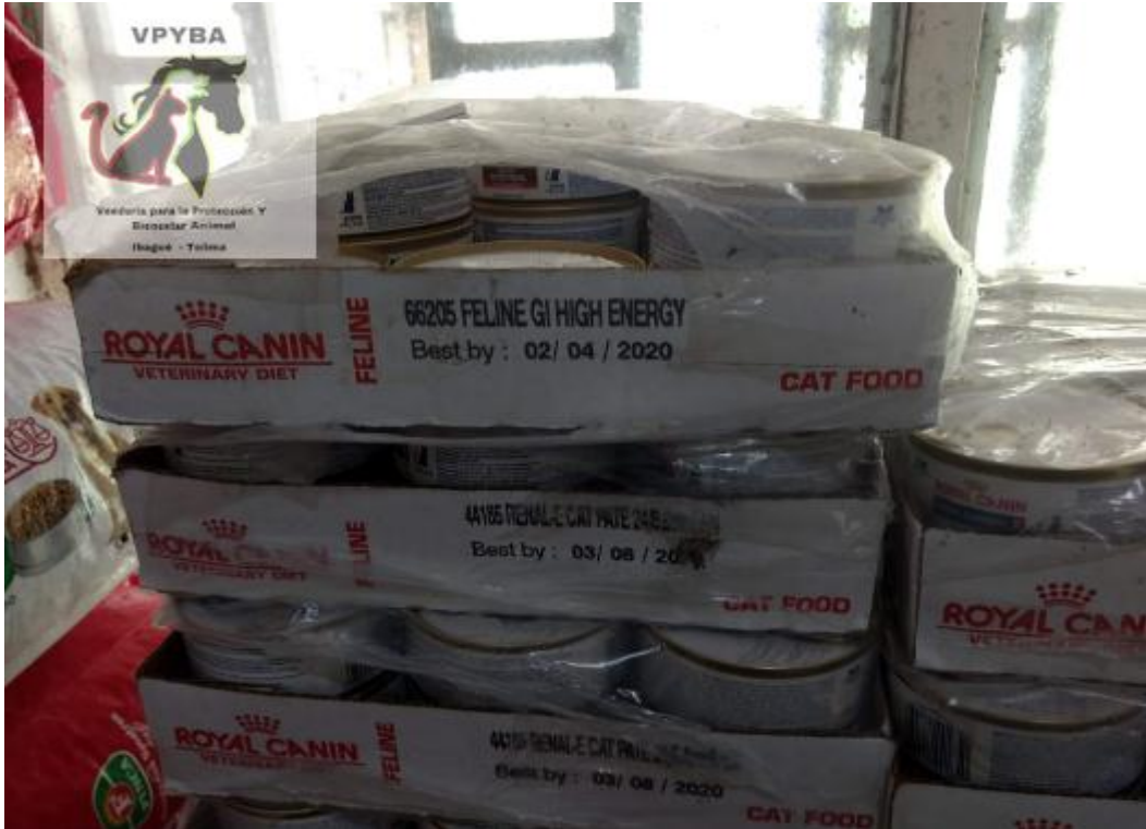
Comida donada a la ALCALDIA DE IBAGUE, comida vencida y se está consumiendo