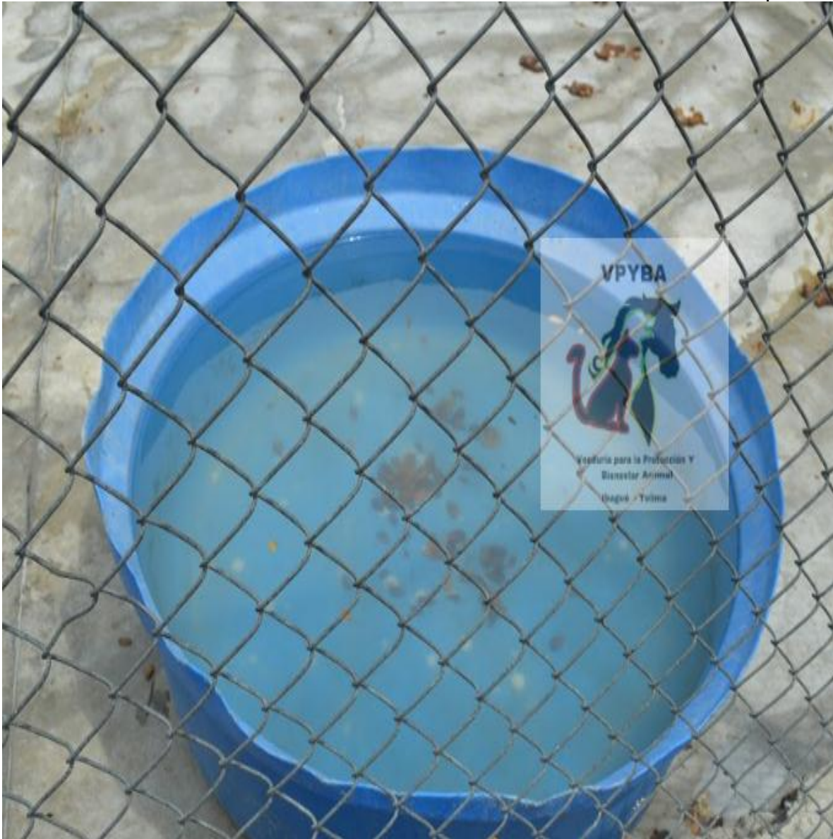
Fotografía del bebedero de los caninos