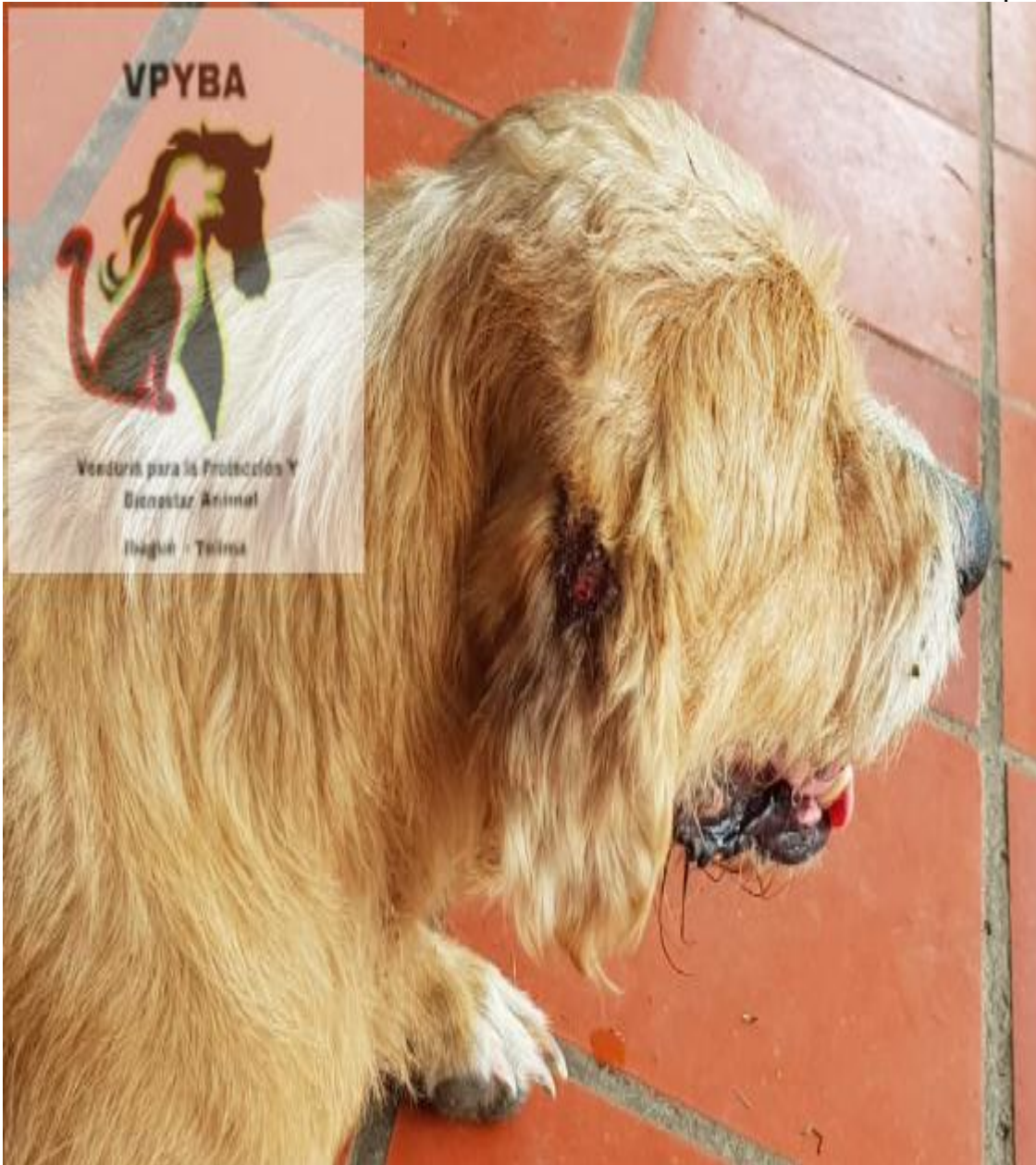
Animales con heridas infectadas que aún esperan tratamiento