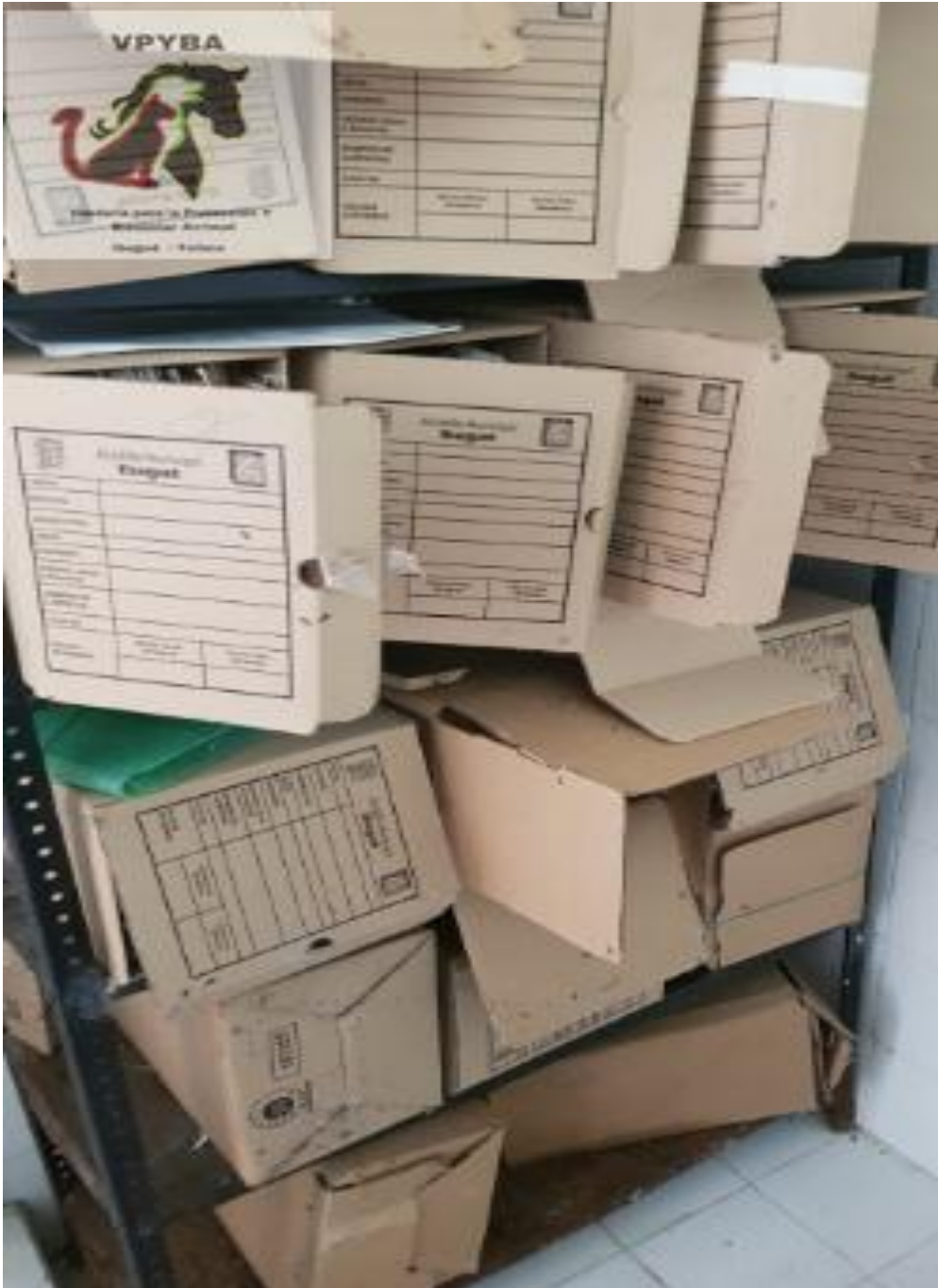
Archivo encontrado en un baño.