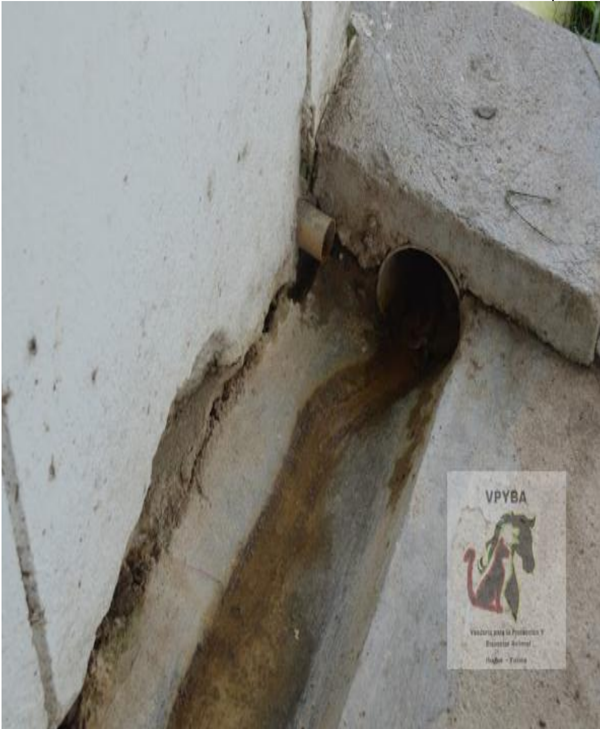
Vertimientos donde desemboca el estiércol de los animales y que está cerca a los animales