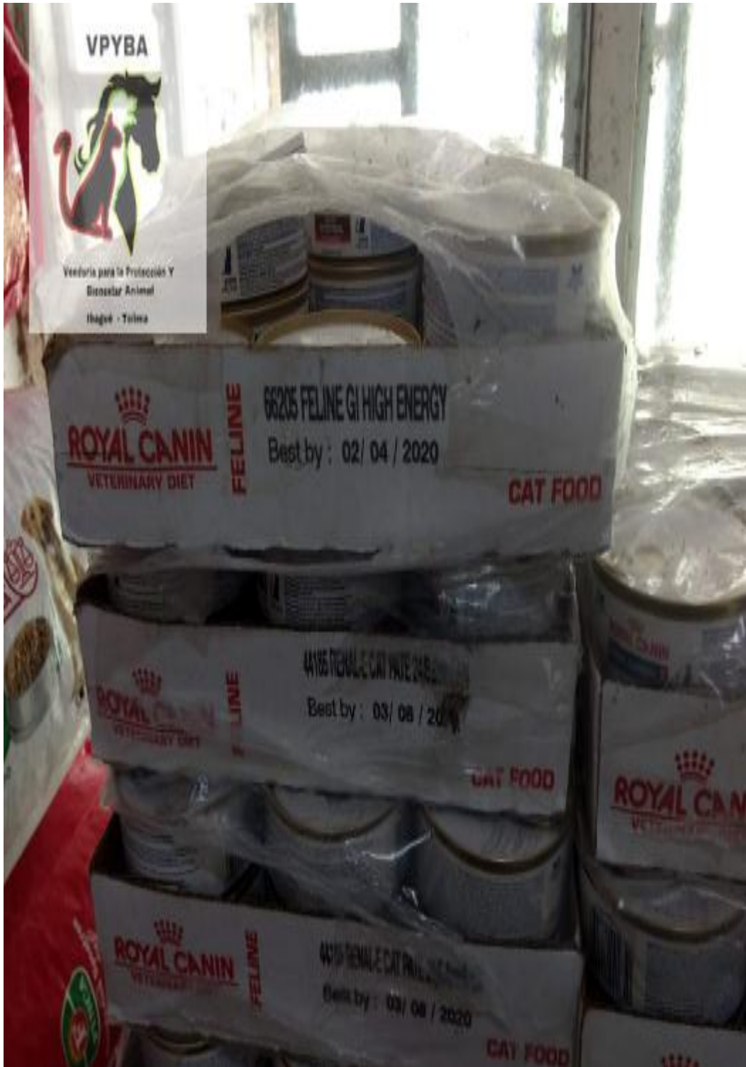
Alimento para gato vencido y consumiéndose (mes/día/año)