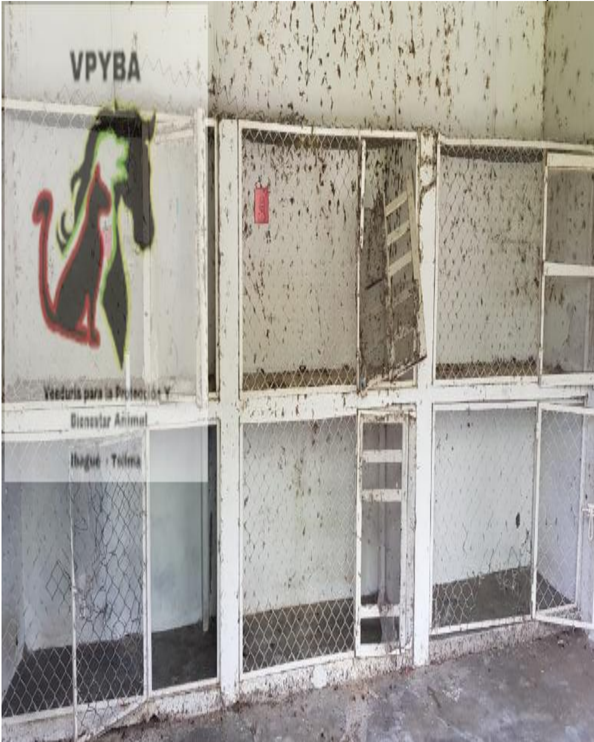
Lugar donde permanecen animales