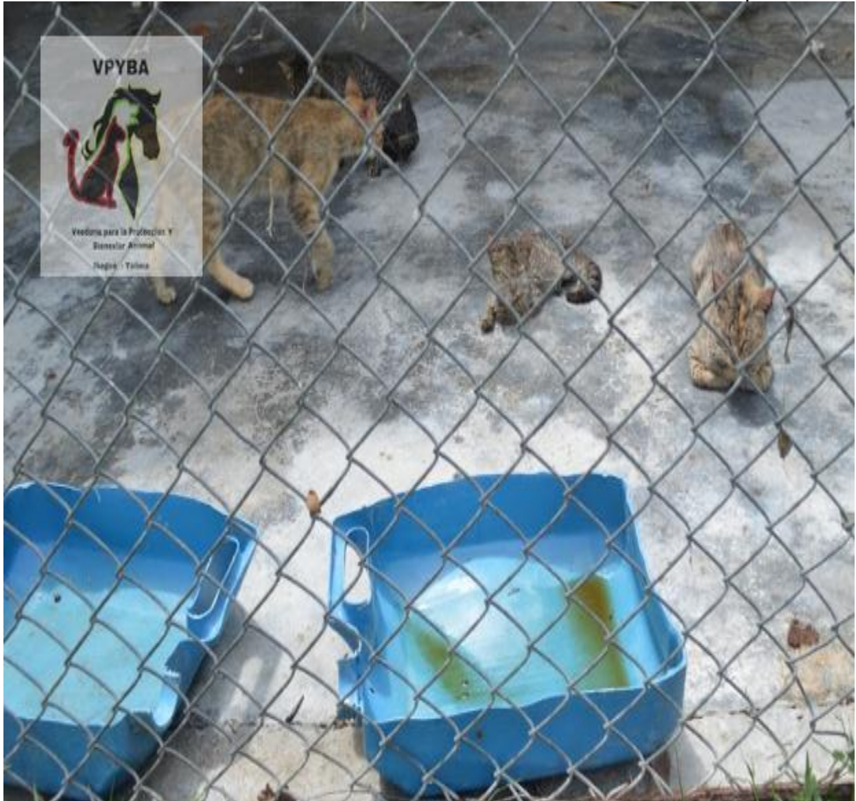
Fotografía de los bebederos de los gatos