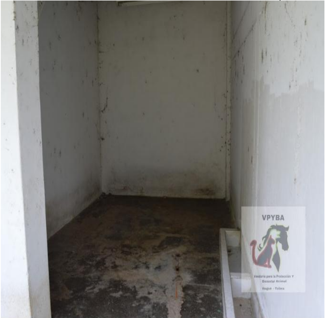
Lugar donde permanecen algunos animales