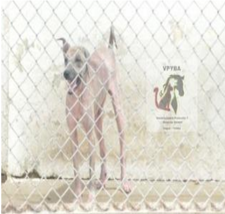
Fotografía de los animales que se encuentran enfermos