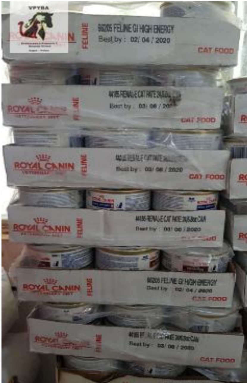
Alimento para gato vencido y consumiéndose (mes/día/año)