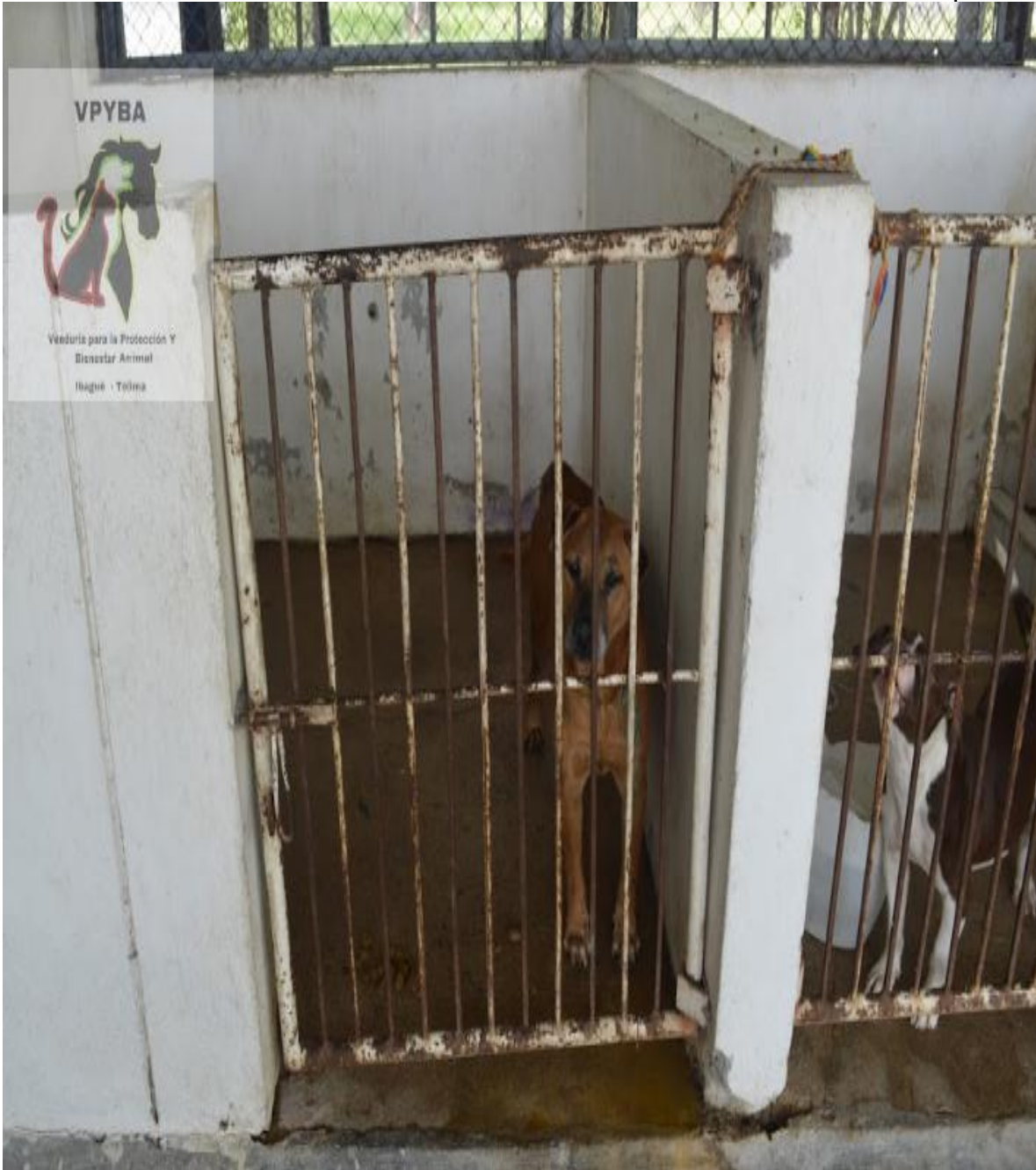
Jaulas donde permanecen los caninos