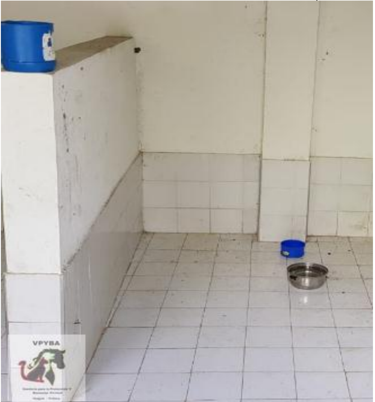
Lugar donde permanecen animales