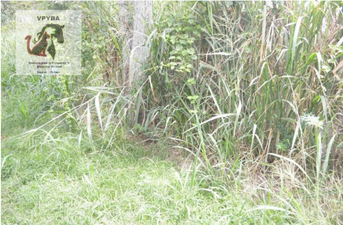
Fotografía de las instalaciones