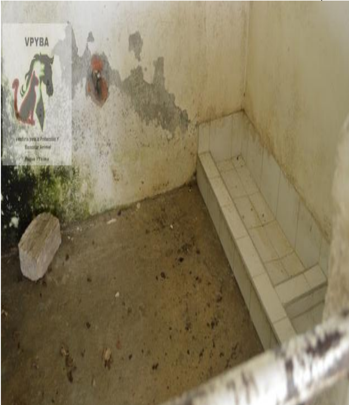
Jaulas donde permanecen los caninos