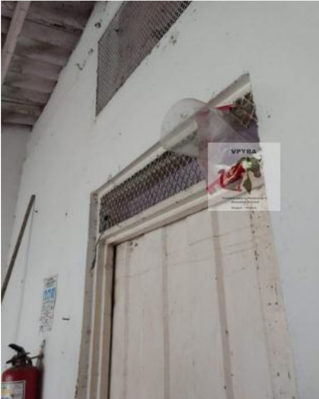
Entrada a la casa