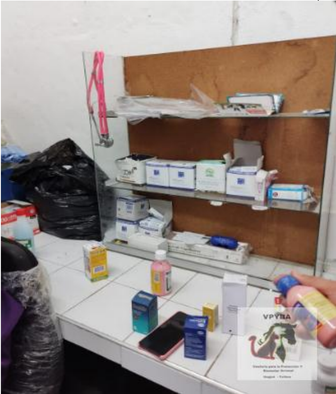
Lugar donde permanecen los medicamentos y quirurgico